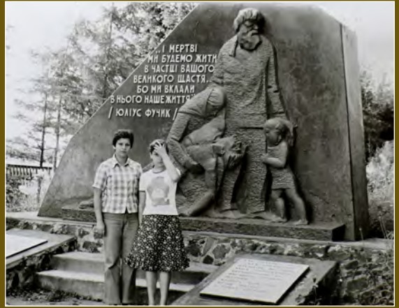
Pomník v Ukrajinském Malíně v roce 1980

Nový kostel v Českém Malíně. V blízkosti kostela byly vybudovány pomníky na památku obětí z Českého Malína a z Ukrajinského Malína