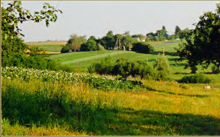
Krajina v okolí Českého Malína na Volyni