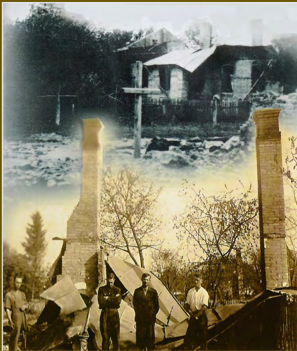
Snímky zničeného Českého Malína jsou převzaty z publikace Český Malín - Lidice volyňských Čechů