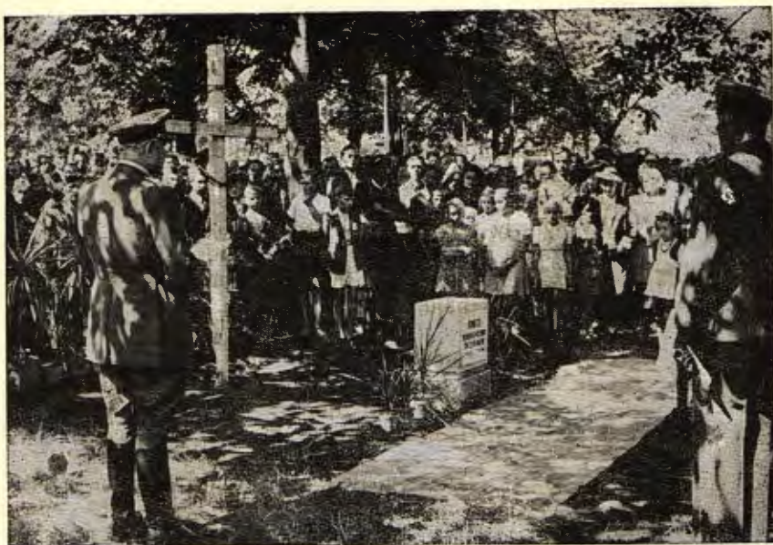
Ministr nár. obrany arm. gen. L u d v í k S v o b o d a při poklepu na základní kámen pomníku malinským obětem 14. VII. 1946 v Žatci