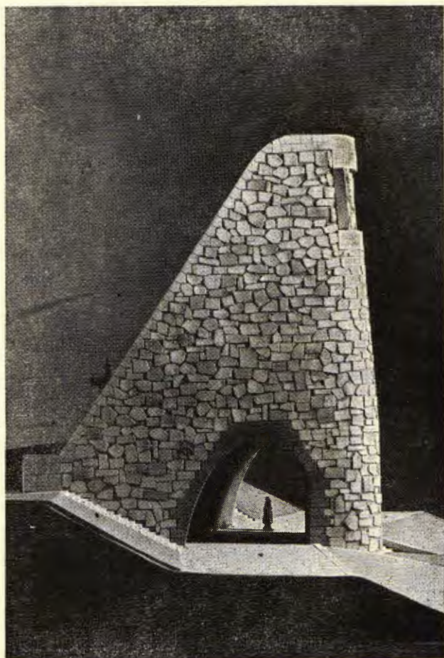
Návrh pomníku padlým v průsmyku Dukelském

svatyni Husa po věk věrnou. Tu zem Amosa Komenského, kolébku svatou rodu svého. Tu vytouženou republiku, již ozářil duch Masaryku, již Beneš velký s vládou slavnou