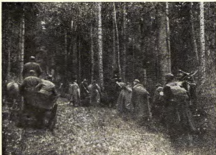
Přesun pěchoty do nových postavení na hranicích ČSR v Dukelském průsmyku

Až začneš čísti v knize slávy, tož k Buzuluku do dálavy svou chvějící se rukou vztáhni a na první tam stránku sáhni. Odtud pak listuj ke Kijevu, pak ku slavnému Sokolovu. Čti první slavnou kapitolu však pozorně, svrchu až dolu. Zde poví tobě ruské pláne jak proslavily české zbraně tvé jméno, dobrý český synu, a pak poslechni Dněpru vlnu, co o hrdinech poví tobě, o těch, co leží v temném hrobě