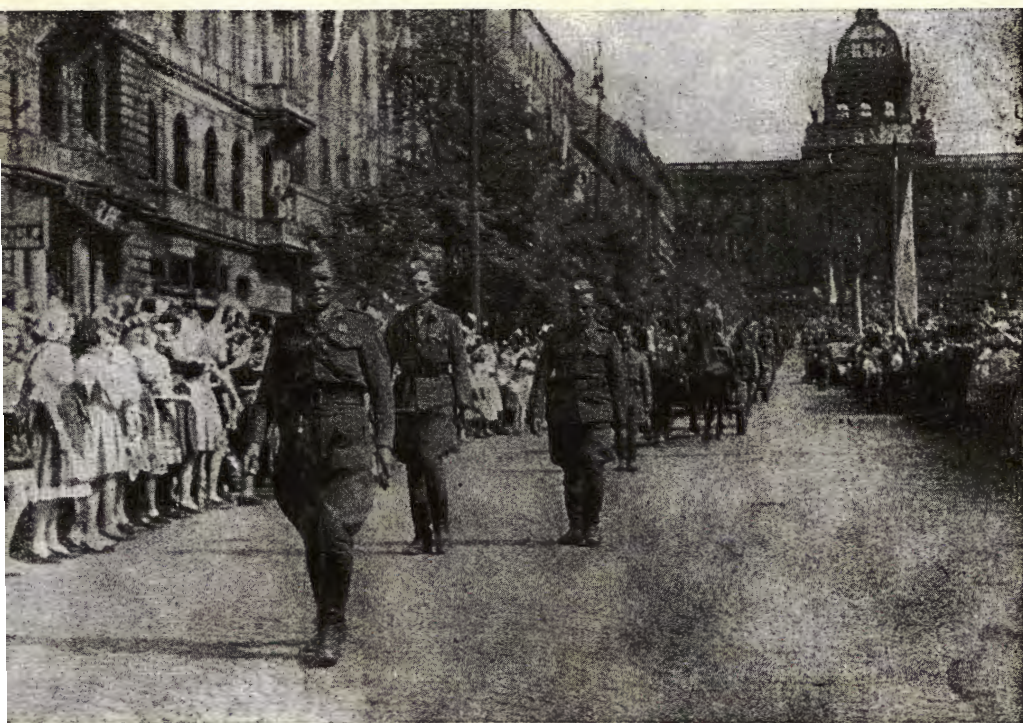
Svobodova armáda v Praze

jim v cestu, na zbraň, na ulice. Je objímá jásosem davů, vavřínem zdobí jejich hlavu a líbá vlajku naši milou, vítěznou modro-rudo-bílou. Máj k pochodu jim písně zpívá a s ním ta lidu vlna živá, to štěstím zpité české plémě, ta celá naše volná země, ty luhy, lesy, pole, háje — vše tančí, zpívá, víská, hraje