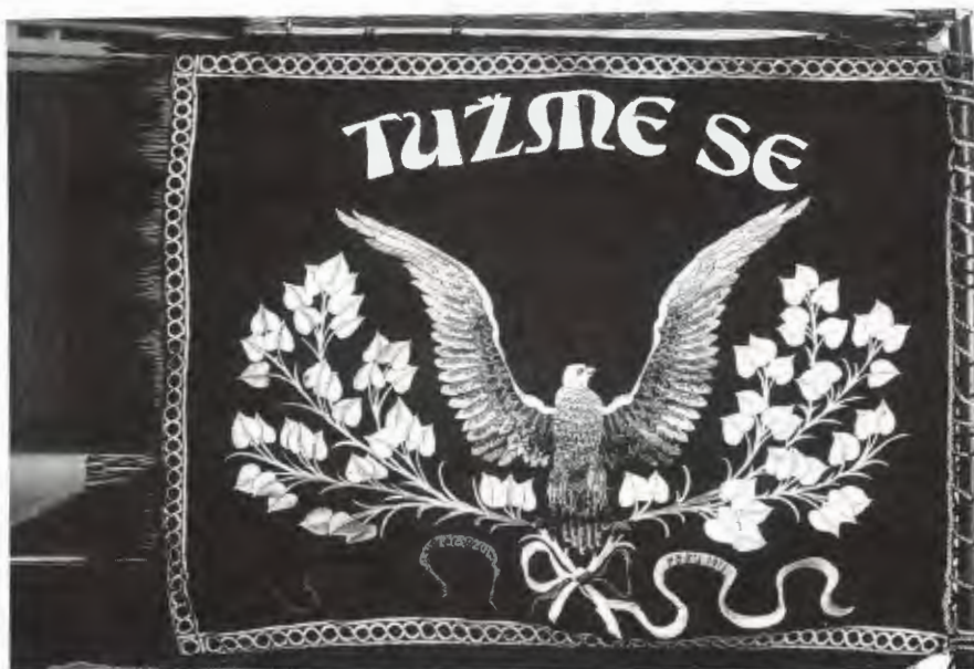
Obr. 14–15: Kvasilovský Sokolský prapor, pohled z pravé i levé strany