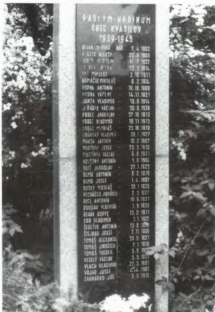
Obr. 29: Jména padlých na památníku v Liběšicích u Žatce. Detail