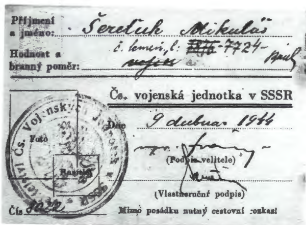
Obr. 22: Vojenská legitimace Druhé - paradesantní brigády v Jefremově a její nositel.