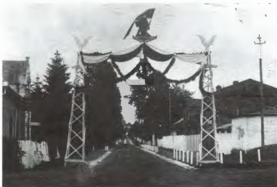
Obr. 13: Hlavní ulice