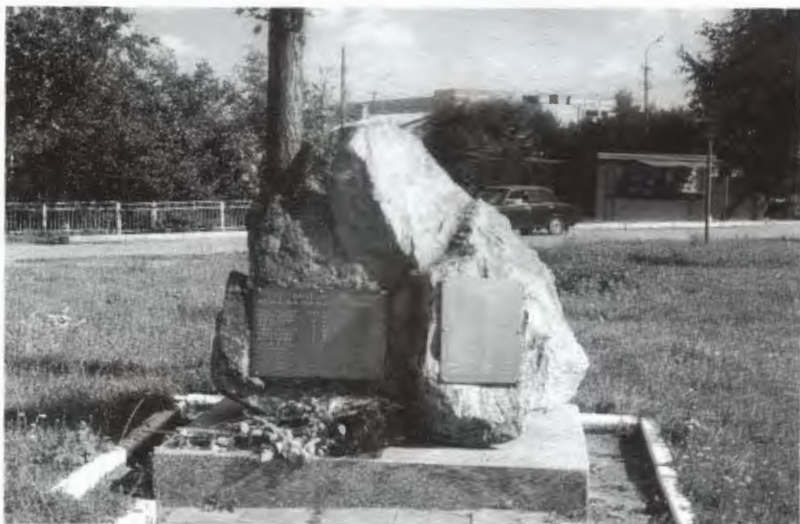
Obr. 30: Památník v Kvasilově, jsou na něm jména padlých Čechů a Ukrajinců