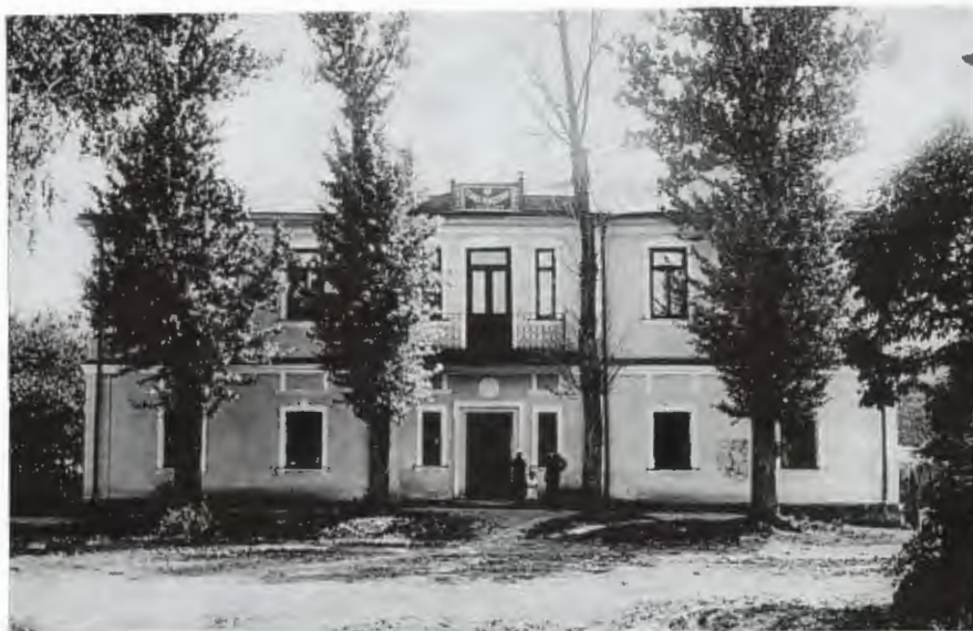
Obr. 6: Pětitřídní polsko-česká škola v Kvasilově