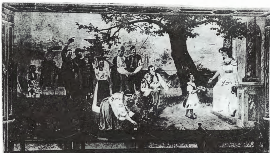
Obr. 4: Opona divadla v Kvasilově, 1907. Popisku (obr. 5) ponecháváme v originále, nesmírně cenném, autentickém dokumentu z roku 1907