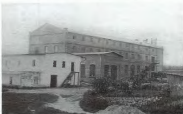
Obr. 19: Pohled na sídlo u Jandurů – bývalé sídlo organizace „Blaník“