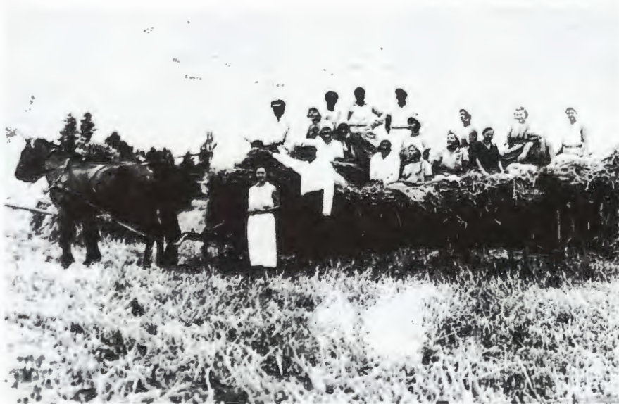
Obr. 3: První dožínky