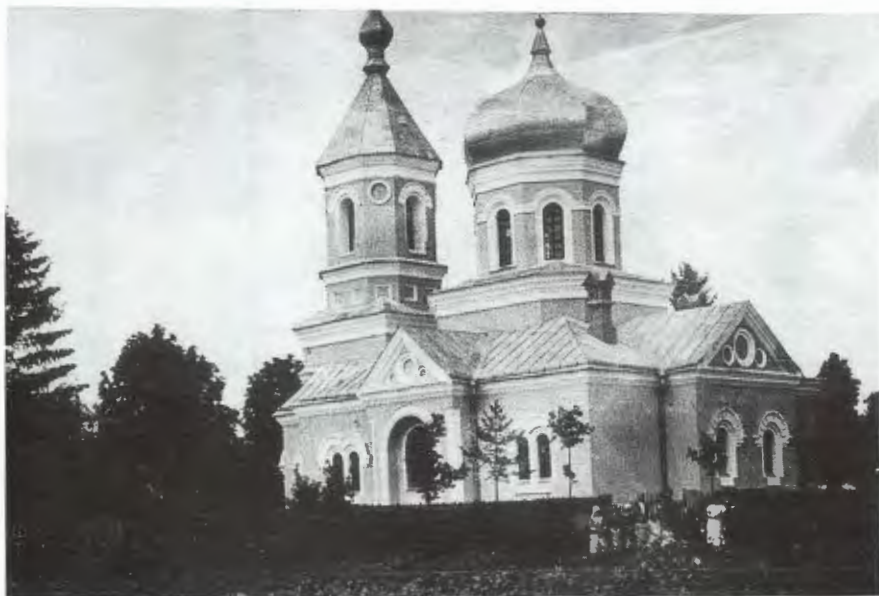
Obr. 8: Pravoslavný chrám v Kvasilově, povýšený v roce 1930 na Sobor volyňský