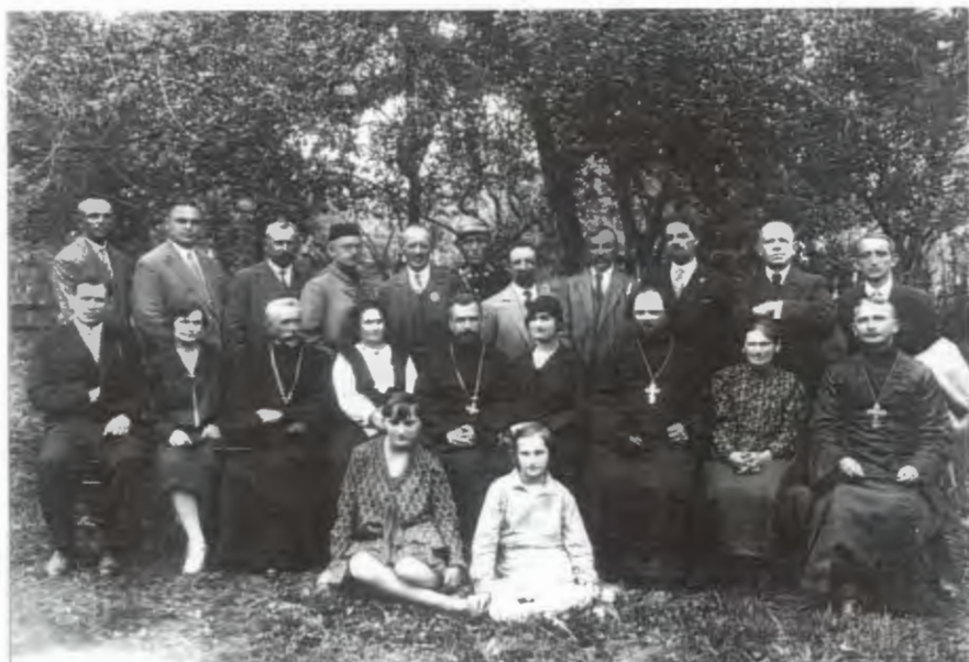
Obr. 10: 50. výročí založení Kvasilova - Poutová slavnost na kvasilovské faře