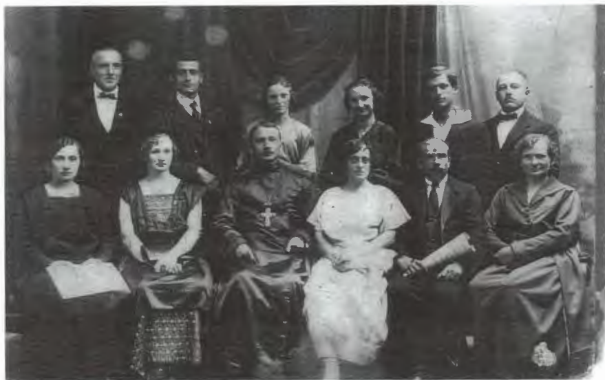
Obr. 9: Církevní pěvecký sbor