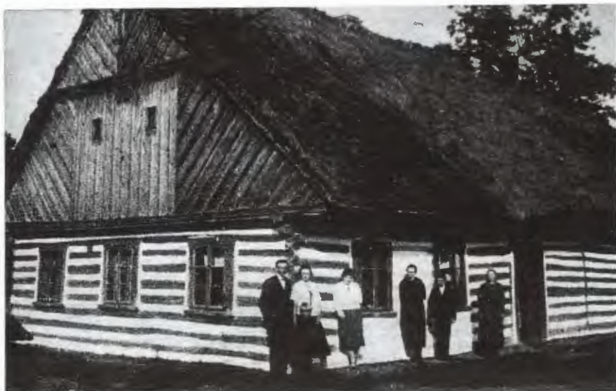
Obr. 2: Staročeská chalupa – jediná v obci. Postavili ji zakladatelé Kvasilova – z rodiny Vacátkových