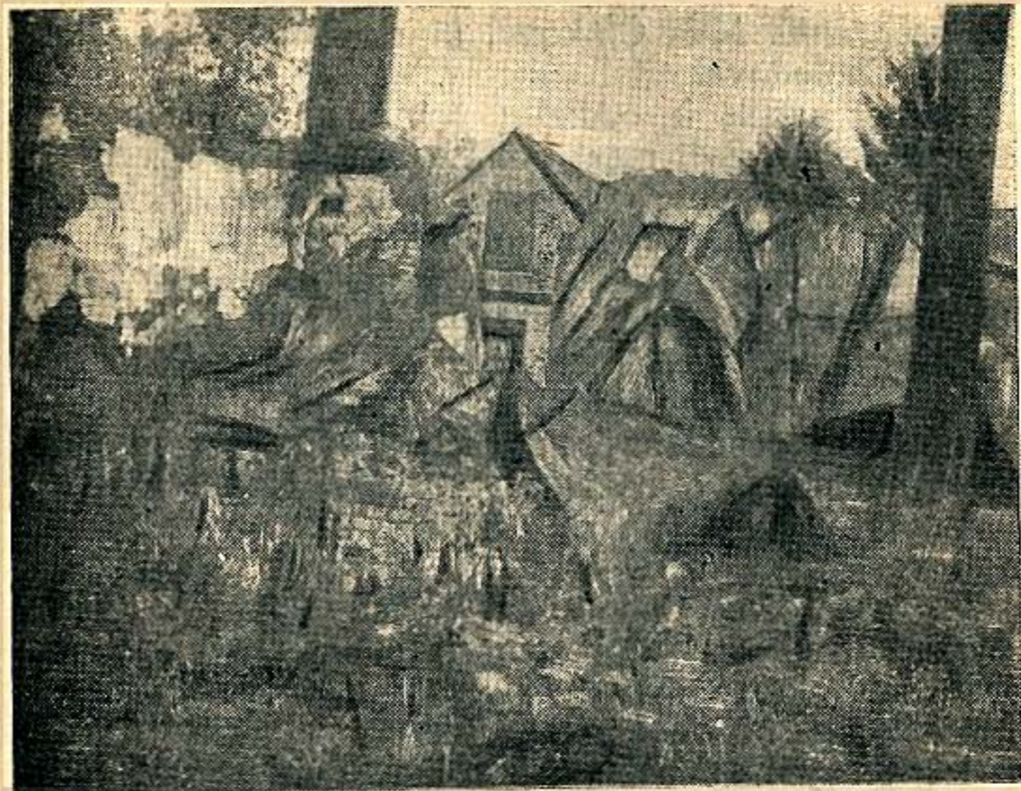
Ssutiny domů v Českém Malíně.

Když jsme přijeli s povozy, naloženými nakradeným majetkem, do Ukrajinského Malína, zůstali jsme stát proti kostelu. Tu stálo německé auto, motor pracoval a dva Němci hadicí polévali čímsi obecní úřad i kostel. Pak Němci naházeli do kostela, školy a obecního úřadu, kde byli napěchováni naši lidé, ruční granáty. V okamžiku všechno počalo hořet.