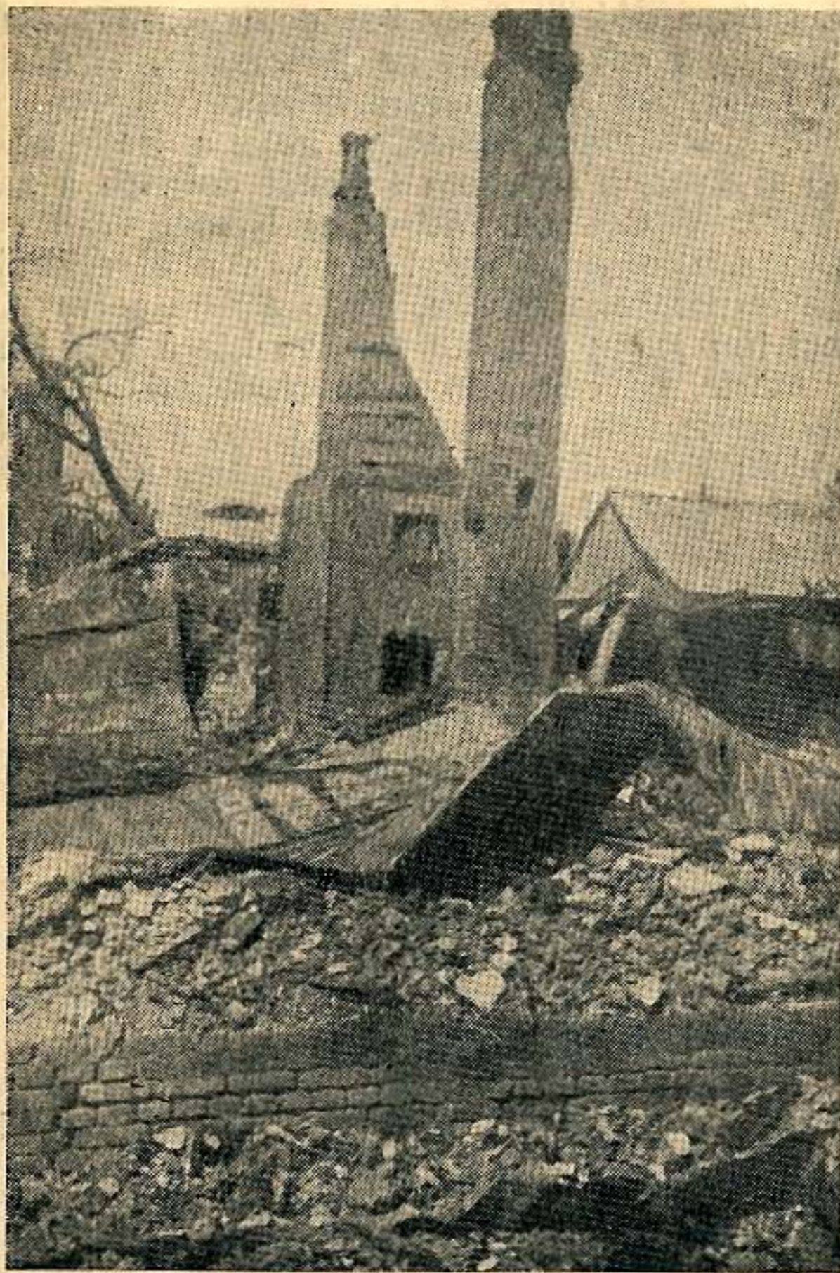
Ssutiny domů v Českém Malíně.

13. července 1943 k 7 hodině ranní přišli k nám dva Němci, jeden důstojník a jeden voják. Řekli, abychom všichni vyšli asi na půl hodiny na ulici. Tam nás Němci shromáždili do větší skupiny a odvedli na náves, kde už bylo mnoho lidí. Pak nás všechny