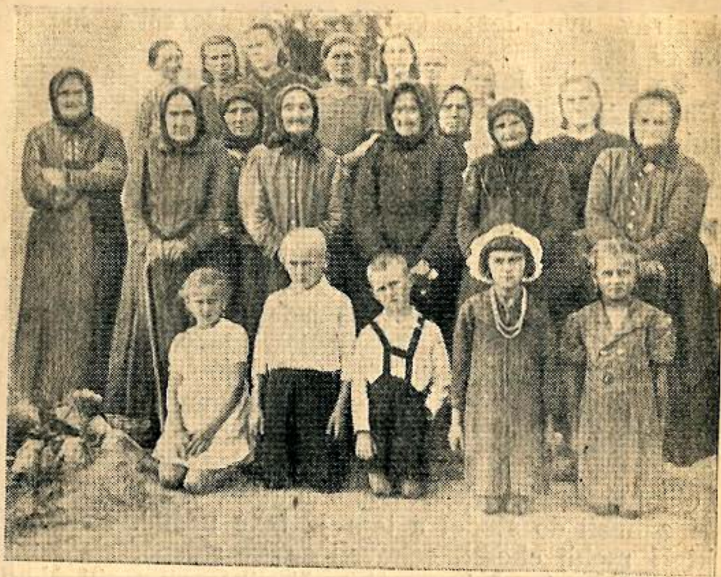
Skupina českých žen a dětí, které unikly smrti.