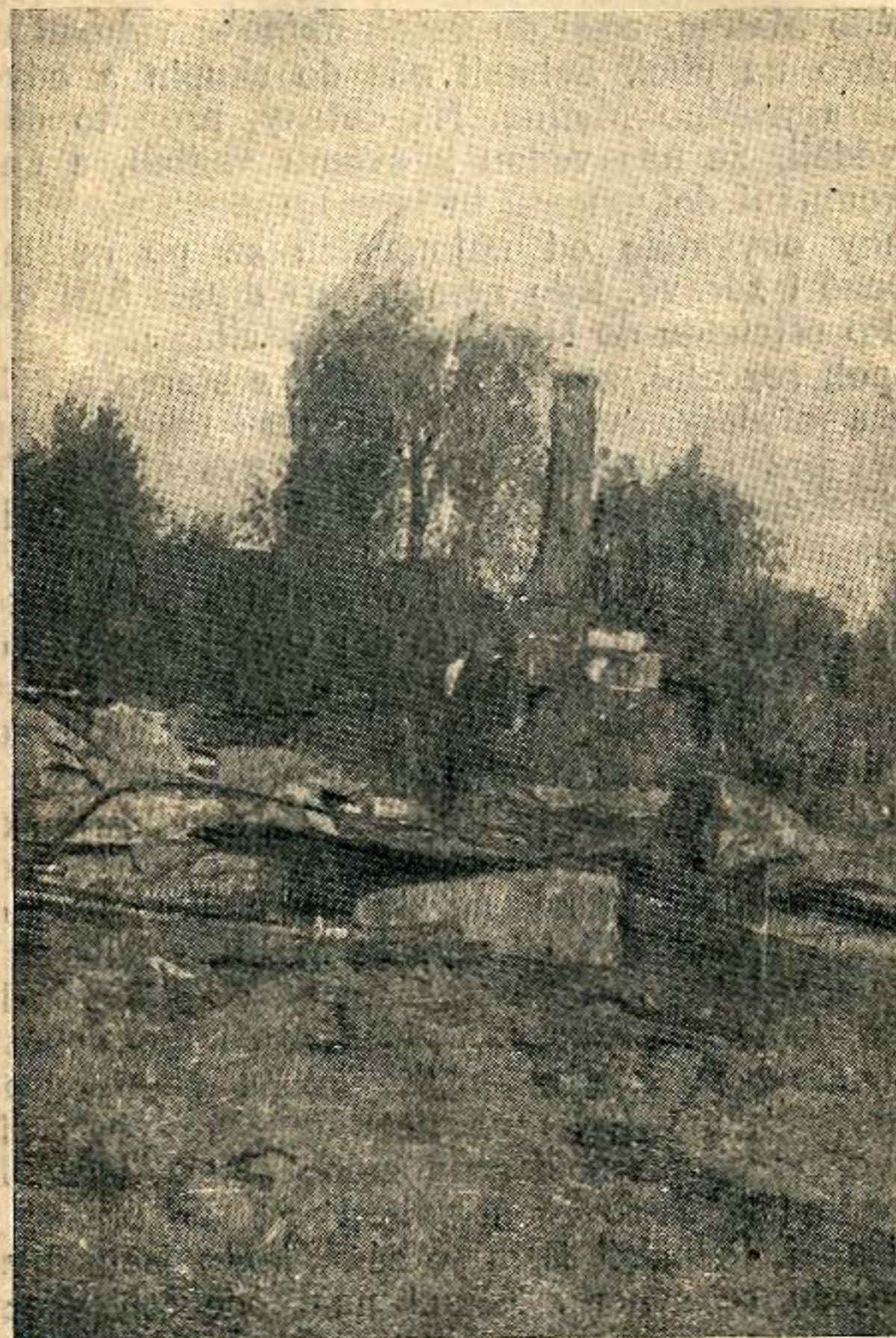
Ssutiny domů v Českém Malíně.