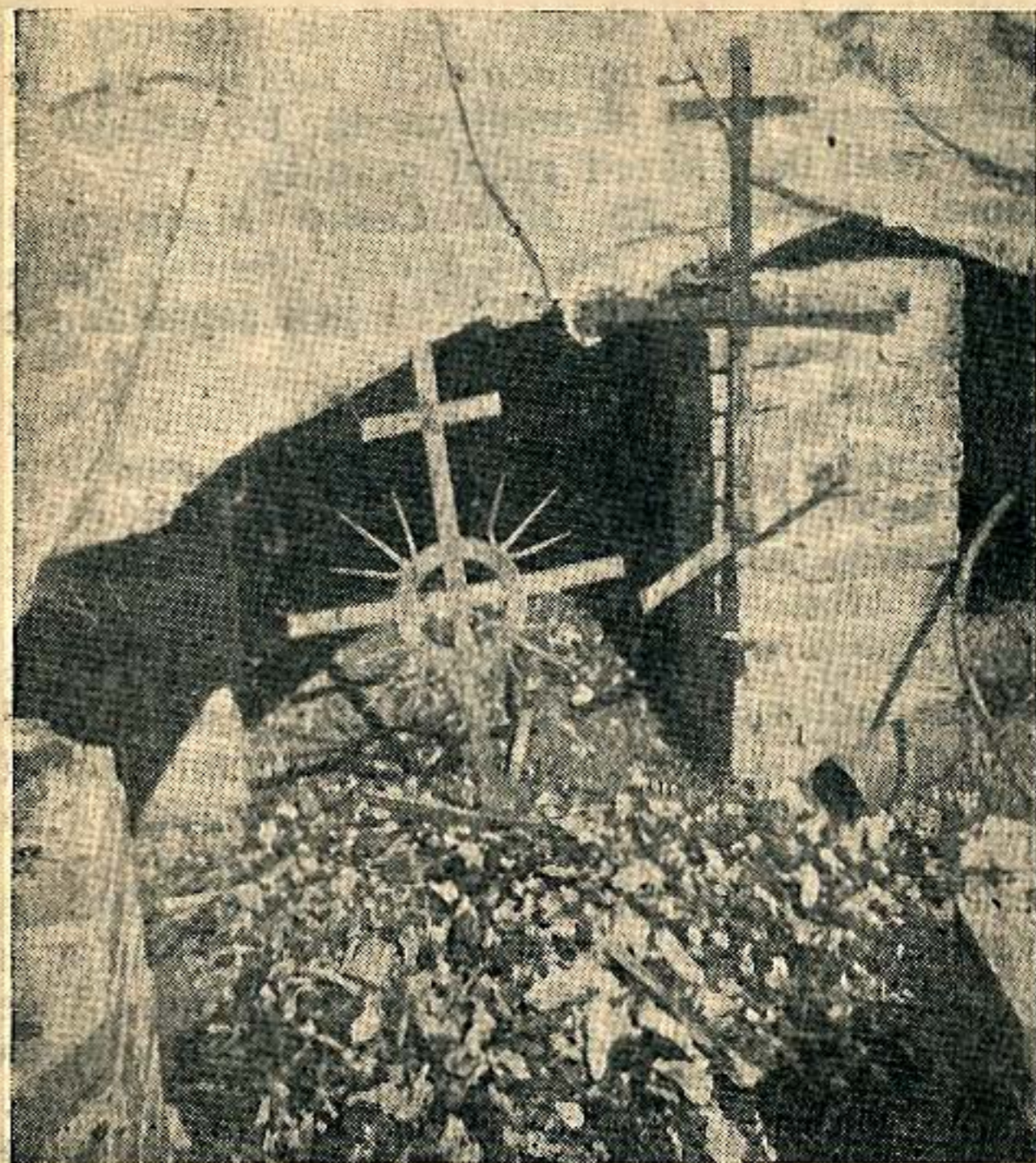
Pozůstatky ohořelých kostí povražděných v kostele v Ukrajinském Malíně

Z násilím sehnání obyvatelstva Českého Malína se zachránili a zůstali na živu jedině ti, kteří 13. července 1943 náhodou nebyli v obci přítomni nebo byli na poli, ti, kteří hnali na rozkaz Němců ulou-