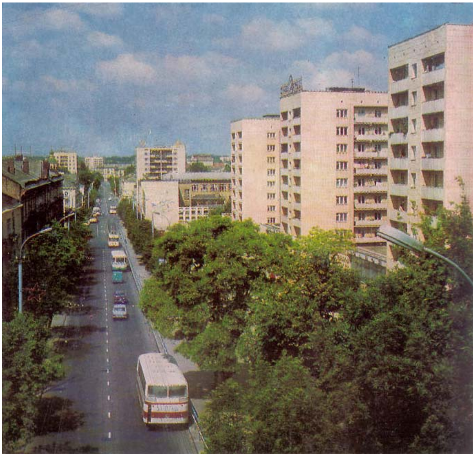
Ulice Lenina – město Rovno