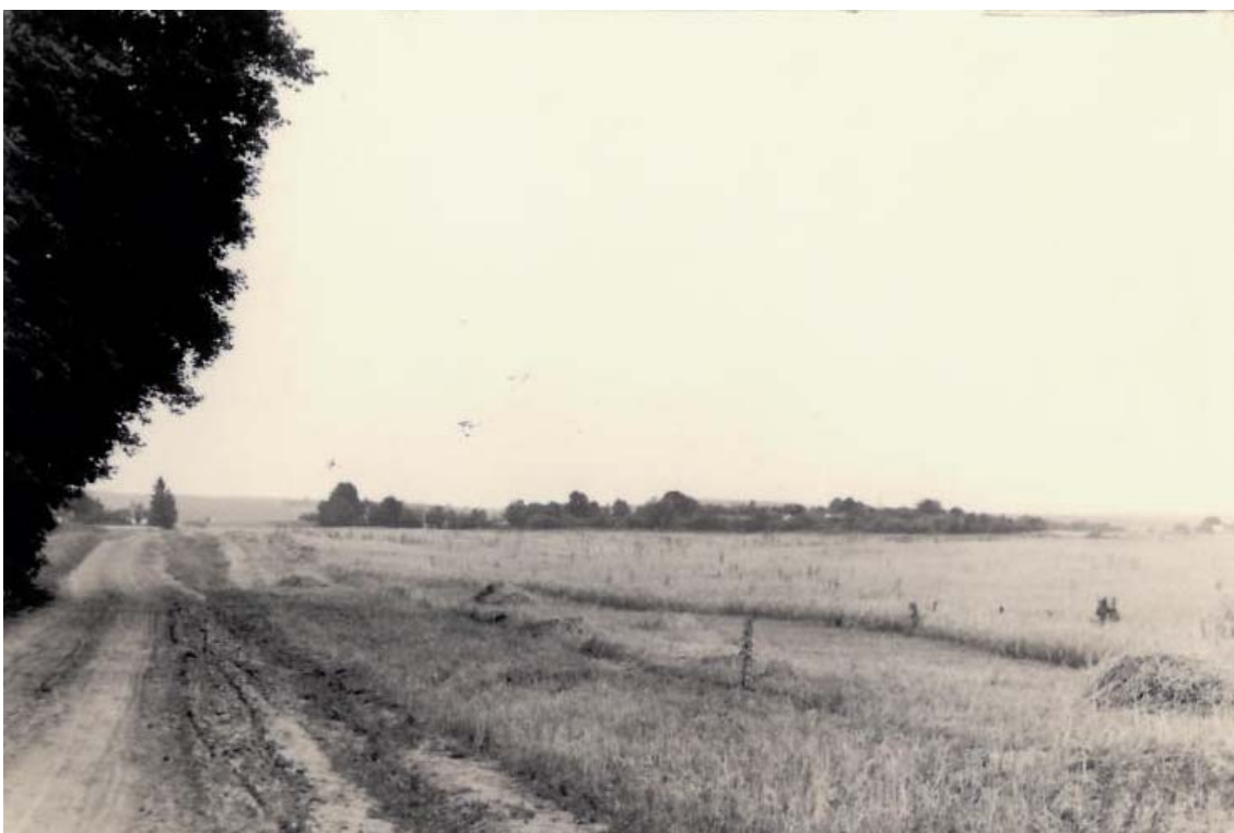
Typický ráz volyňské krajiny – pohled na Dembrovku od českého hřbitova

Až půjdu domů, půjdu sama a pěšky, budu se bát, strašně se budu bát, že už tam naše chát' nestojí a že se všechno ztratilo.