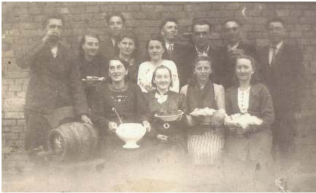
Konec masopustu – r. 1946