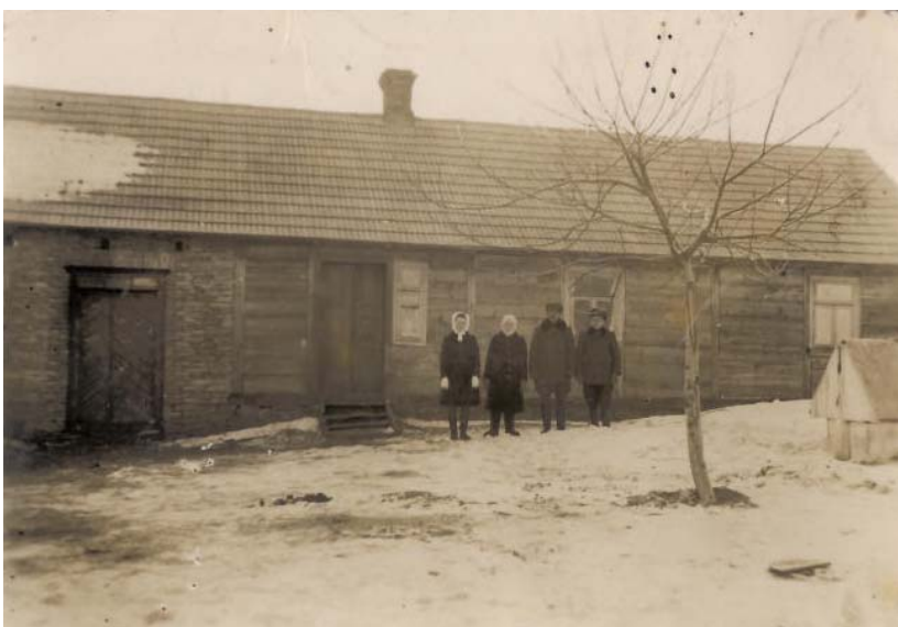
Typický dům na Volyni – majitel A. Kubáček