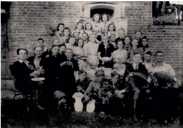
Dembrovská mládež – r. 1945