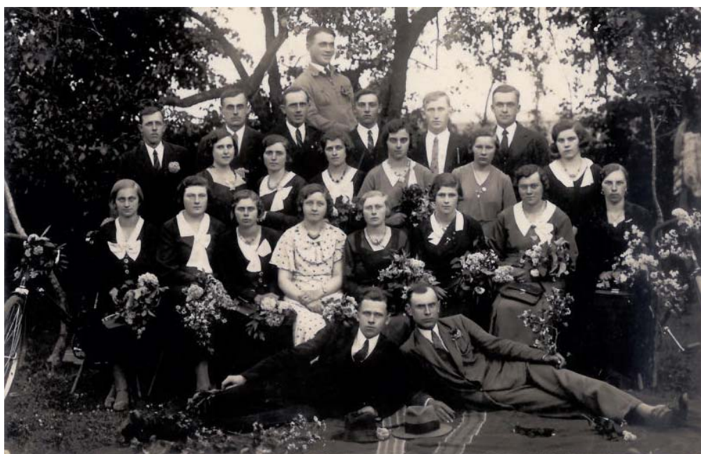
Dembrovská mládež – r. 1932