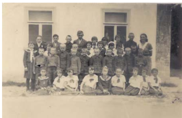
Žáci dembrovské školy – r. 1936