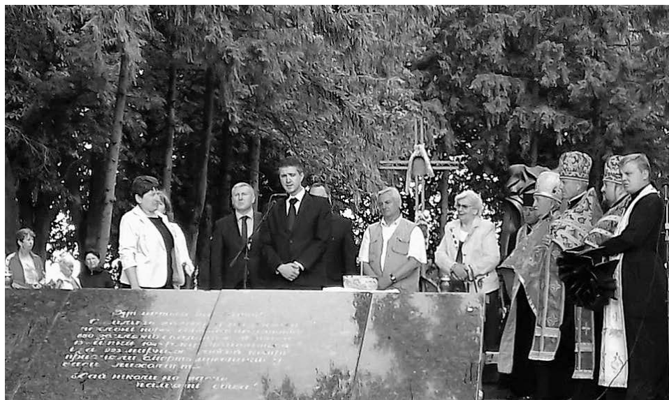
Pieta v Malíně na Ukrajině za účasti: generální konzul České republiky ve Lvově Mgr. Pavel Pešek při projevu

Další den dopoledne se náš zájezd zúčastnil smuteční tryzny v Malíně. Uplynulo již 74 let od brutálního vyvraždění malínských občanů. Obřad začal pravoslavnou zpívanou mší, po ní promluvila paní starostka Malína, český konzul ze Lvova a další. Zazpívali jsme českou hymnu.