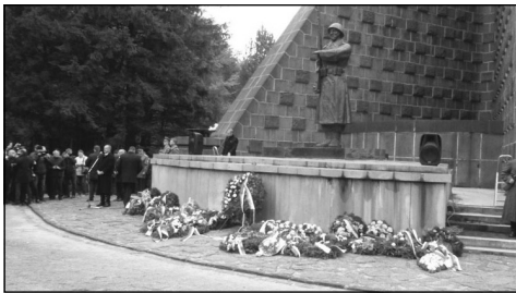
Fotografie ze vzpomínkových oslav Karpatsko-dukelské operace