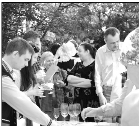
Fotografie z vernisáže

republiky. Tento zájem ve velké míře ovlivnil jeho budoucí vědeckou činnost, kterou iniciovala jeho diplomová práce jako studenta pedagogické fakulty Univerzity Palackého v Olomouci.