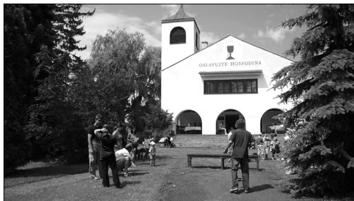
Kostel v Chotiněvsi

Když nacisté začali ustupovat sovětské armádě, narukovali v roce 1944 téměř všichni muži z Boratína od 15 do 50 let věku do Svobodovy armády a přes Duklu přijeli jako osvoboditelé na tancích do Prahy. Zůstali již v Čechách, a intenzivně se vyjednávalo o návrat jejich rodin. V roce 1947 opět za dramatických okolností – u Volyňáků jak jinak – přivezla velká vlaková souprava za třicetistupňových mrazů celou vesnici i s mobiliářem kostela.