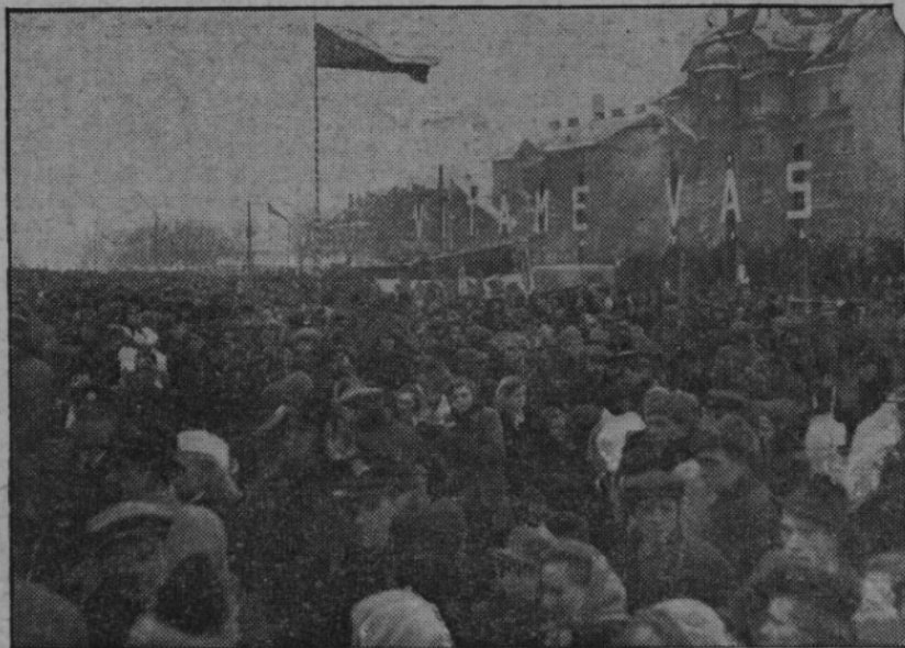
Zatec vítá stále nové transporty volyňských Čechů