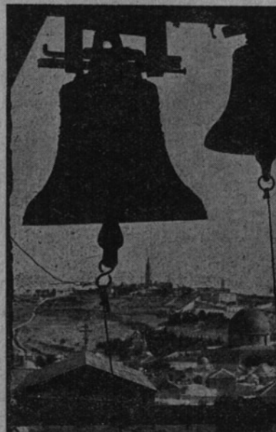
Po celém světě rozezněly se zvony na oslavu míru