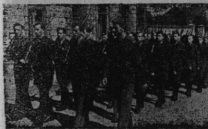
Ti kteří došli budou strážci odkazu padlých kamarádů