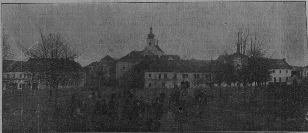
V Podbořanech a v celém okrese našlo nový domov mnoho set rodin vol. Čechů