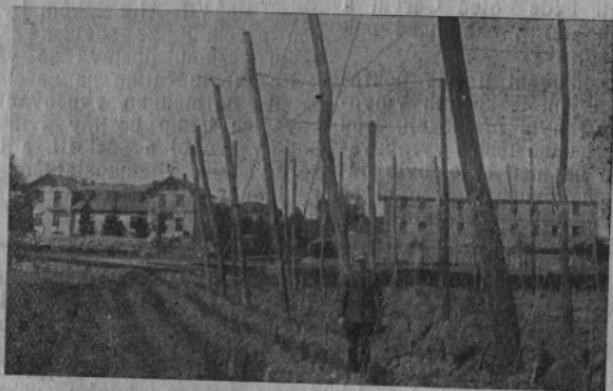
Výstavné budovy, krásné chmelnice byly chloubou Hulečských