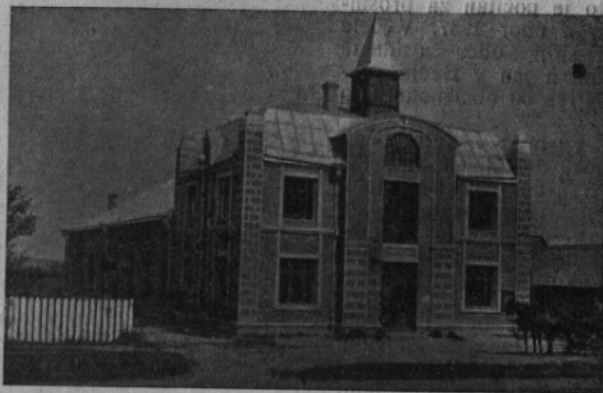
Národní dům v Hulči středisko vlasteneckého dění

lečtí v Americe, kterých je tam přes 20, vedou si opravdu dobře. Také ve svépomoci a v darech na Malínský fond jsou Hulečtí první. I na výstavě