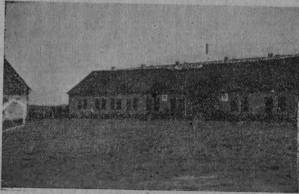
Část budov podbořanského střediska