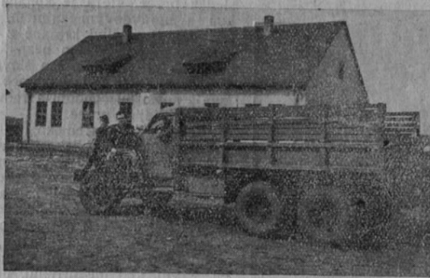
Auto podbořanského střediska připraveno k dovážení reemigrantů na místo usídlení

V klidu rodinného štěstí, po tolikém utrpení, které mnohdy se zdálo bez konce, dočkají se naši na Podbořansku klidu a pokoje a jejich kvalitativní osobní a národní stane se nejkrásnějším drahokamem koruny svatováclavské v pohraničí. J. Dk.