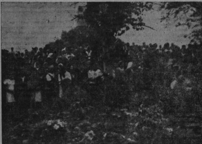
Pietní oslavy ve výročí Českého Malína na Volyni 1945

nejčistších slibech a vřelých ujštěních představitelů nejvyšších orgánů vlády československé mohl být vykonán tak hanebný čin československým občanem. Nechceme ani věřit, že ten člověk mohl pocházeti z české matky a českého otce a že v jeho těle koluje česká krev. — Nedá se ničím změřit, jak bol,