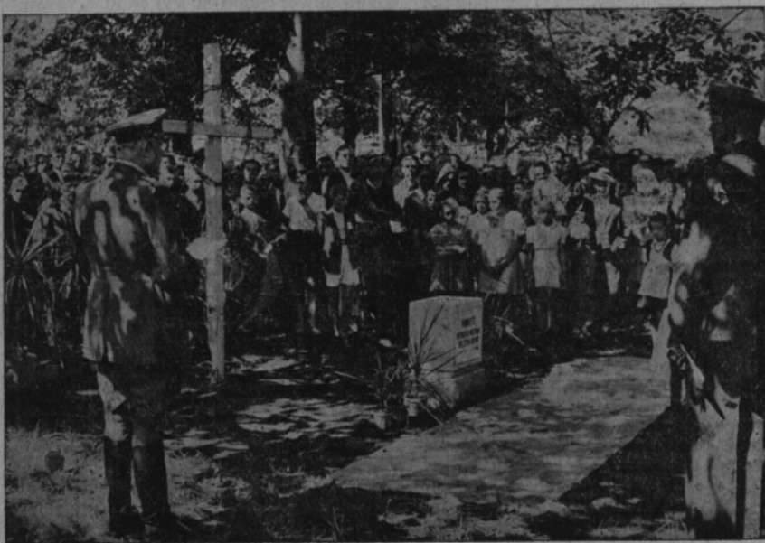
Ministr nár. obr. arm. gen. Ludvík Svoboda při projevu u základního kamene pomníku malínských obětí v Žatci 14. 7. 46.

každou sílu pro hospodářskou obnovu válkou zničené vlastní země. Sovětský svaz tak dodržel doslova slib, daný volyňským Čechům za války. Je to dalším důkazem upřímného sovětského přátelství k Československu, úspěchem čs.-sovětské spolupráce. Je třeba, aby i všichni volyňští Čechové si toho byli vědomi a zůstali Sovětskému