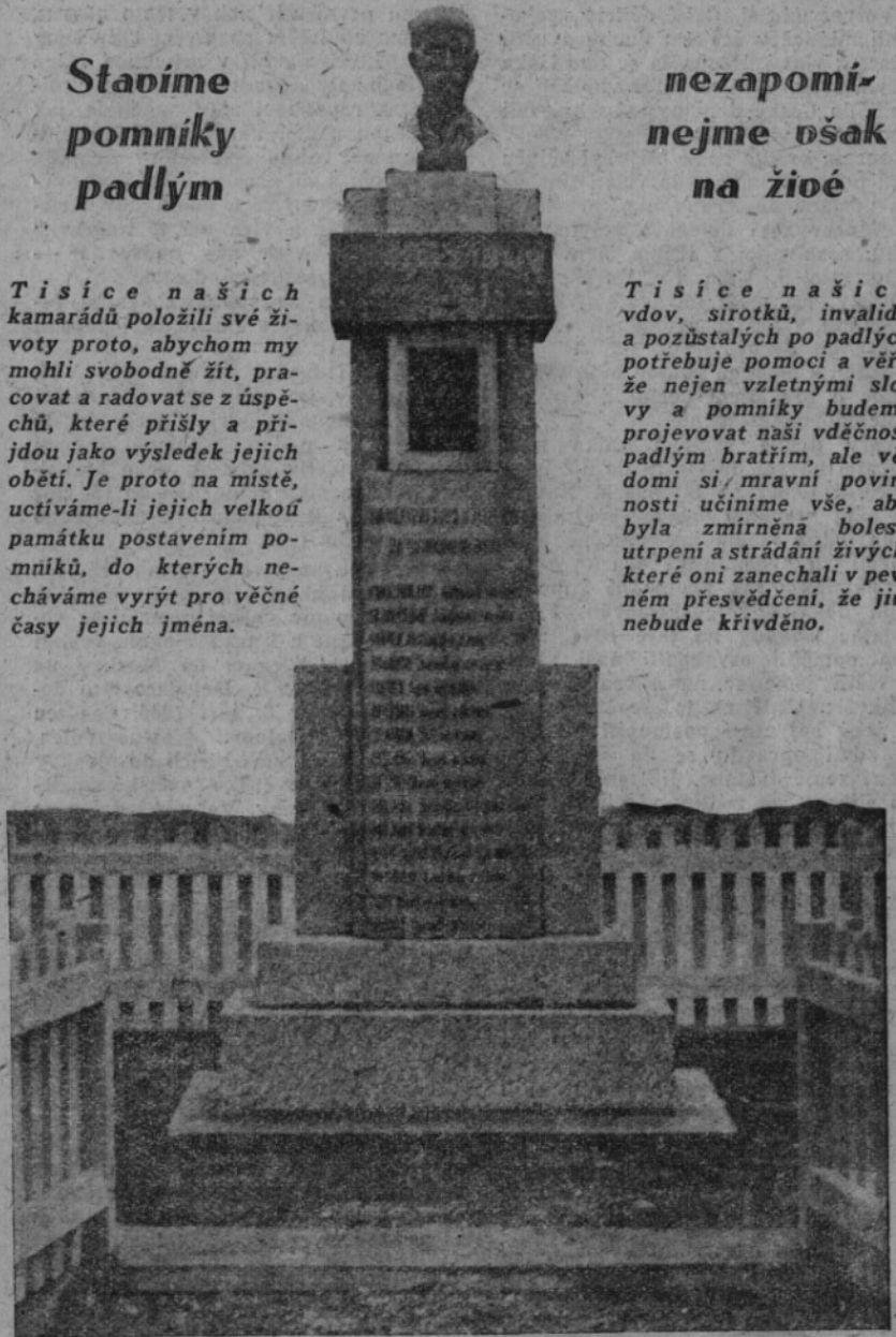
Pomník padlým bratřím z obce Buršovky na Volyni, který postavili jejich kamarádi v Liběšovicích na Podbořansku.

Tisíce našich vdov, sirotek, invalidů a pozůstalých po padlých potřebuje pomoci a věří, že nejen vzletnými slovy a pomníky budeme projevovat naši vděčnost padlým bratřím, ale vědomi si mravní povinnosti učiníme vše, aby byla zmírněna bolest, utrpení a strádání živých, které oni zanechali v pevném přesvědčení, že jim nebude křivděno.