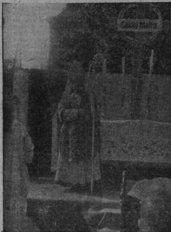
Symbolický kříž s nápisem „Český Malín“ u oltáře mluvil ke všem přítomným o velkém utrpení a bolesti a o obětech volyňských Čechů, jež přinesli pro blaho celého národa.

Celkově můžeme býti s oslavami v Žatci po každé stránce spokojeni. Třeba však si něco připomenouti, co by se příště nemělo opakovat. Pro bohoslužby vyhrazen byl čas od 9 do 10 hodin. Tento termín vyjma katolíky nedodržela žádná jiná církev. Tím se také stalo, že z pravoslavných zúčastnila se průvodu jen malá část a evangelici a baptisté žádní. Průvod podle programu dorazil přesně v 11 hodin na náměstí. Byl mohutný, ale mohl býti mnohem větší. Katolíci dorazili na seřadiště již seřazení. Taktéž vdovy a zvláště mládež a zahr. vojáci v uniformách byli ukázněni. Těmto máme co děkovat za důstojný ráz oslav.