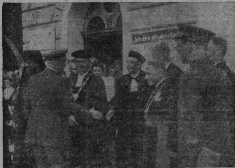
Ministr národní obrany arm. gen. Ludvík Svoboda u žatecké radnice 13. VII. 1947 při uvítání s představiteli církve.