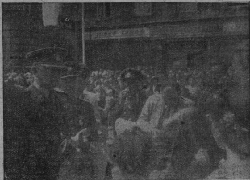
Volyňští sirotci vítají ministra NO arm. gen. Ludvíka Svobodu v Žatci 13. VII 1947

Volyňská mládež v Jesenicích. Na rozloučenou s Jesenicí uspořádá 17. srpna Doplnovací a rekreační škola volyňské mládeže Národní slavnost. Dopoledne bohoslužby pravoslavné a katolické, lehkotletické závody. Odpoledne průvod obcí a slavnostní akademie na hřišti koupačů.