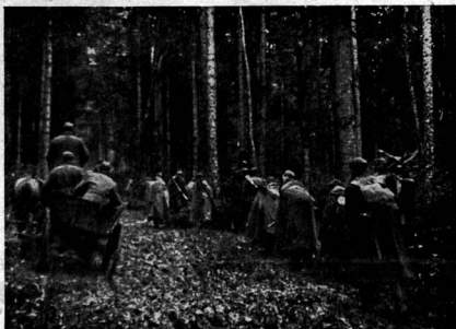
Hory, lesy a bezedné bláto — to byly podmínky, za kterých jen nadliděské úsilí těla a ducha každého jednotlivce mohlo vytvořit předpoklady pro úspěch a vítězství.

řadý jednotky 1. čs. sboru dvě divise Rudé armády a jejich čelní sledy jsou vzdáleny od hranice republiky 3–4 km. Vesnici Barvinek probíhá státní silnice, směřující k jihu na Dukelský průsmyk. Silnice určuje všeobecný směr útoku a jest nejbližší spojnicí k naší vlasti. Všichni jsou připraveni proběhnout tuto vzdálenost