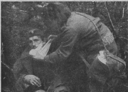
Vítězství bylo dosaženo za cenu velikých obětí a utrpení. Desítky tisíců bratří rudoarmějců a tisíce našich kamarádů - vol. Čechů, zakarpatských Ukrajinců a Slováků životy zaplatilo naše úspěchy. Za vyjimečně šťastného byl považován, kdo byl ležce raněn. Volyňská dívka ošetřuje raněného.

Před německými kryty svádí se krátký, zuřivý boj. Rotmistr padá, raněn stíleou ze samopala k zemi a přímo na minu, která mu rve obě nohy. Hrstka mužů vrhá se vpřed, aby kryla odsun smrtelné raněného velitele. Nedaleko za bitevní čarou dodychává. Víte, jaké byly jeho zájmy ve chvíli, když mu život z čertových ran již unikal? Četl vědět, zda se naši na kóte udrželi a jestli jeho velitel, kapitán, živ a zdrav. Řádl, jak na to přistít jít. Četl žít, ale nikoliv jako mrtvák. Ptal se, zda bude do konce války opět boje