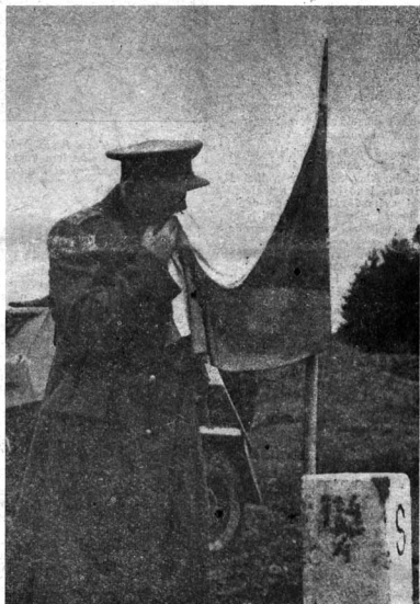
6. října 1944. Velitel 1. čs. arm. sboru v SSSR gen. Ludvík Svoboda líbá čs. státní vlajku, kterou vztýčilo na hranicích republiky v Dukelském průsmyku průzkumná hlídka automaticků.

Sovětská vojska Karpaty dobyla a přestla; ale na bojištích zůstaly ležet