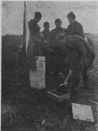
Posvátná páda od hranic vlasti, zbrocená krví nejstarších a nejvěrnějších synů a dcer, byla pietně chráněna a po vítězném boji uložena v Památníku osvobození v Praze.