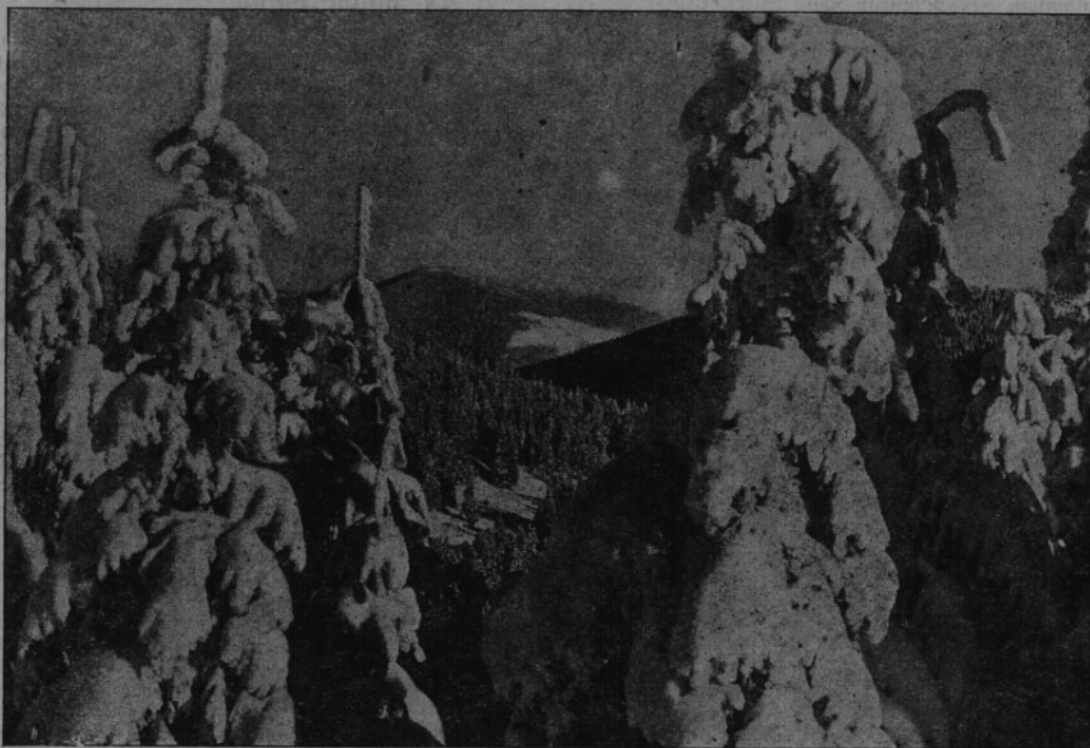
První sníh je tady jako předzvěst blízké zimy