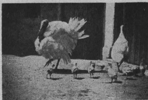
Bílé kráty. Volný pastevní výběh má pro kráty stejnou důležitost jako pro ostatní drůbež. Slunce a vzduch napomáhá vývoju a zvyšuje odolnost proti nemocem.

Má-li hospodine chovat kráty s úspěchem, je nutné, aby jim poskytl dostatek pastvy, a to buď v lese, na lukách nebo v poli. Potom může přikrmovat drůbež jenom jednou denně, a to večer, aby se naučila vraceti do kurníku. Má-li drůbež dostatek pastvy, je jistě rentabilní ům, je poskytnete dostatek chutného masa, vajec a peří, které jest pružné (kráta virginská). Chováme-li kráty společeně s drábeli, budeme pamětliví a postavíme hřady vzdálenější, aby mohly kráty přeucovat. Podobně i hlázdá musí být prostornější. Máleme jednoho krocaná počítati na 6–10 krát, ovšem tento nesmi