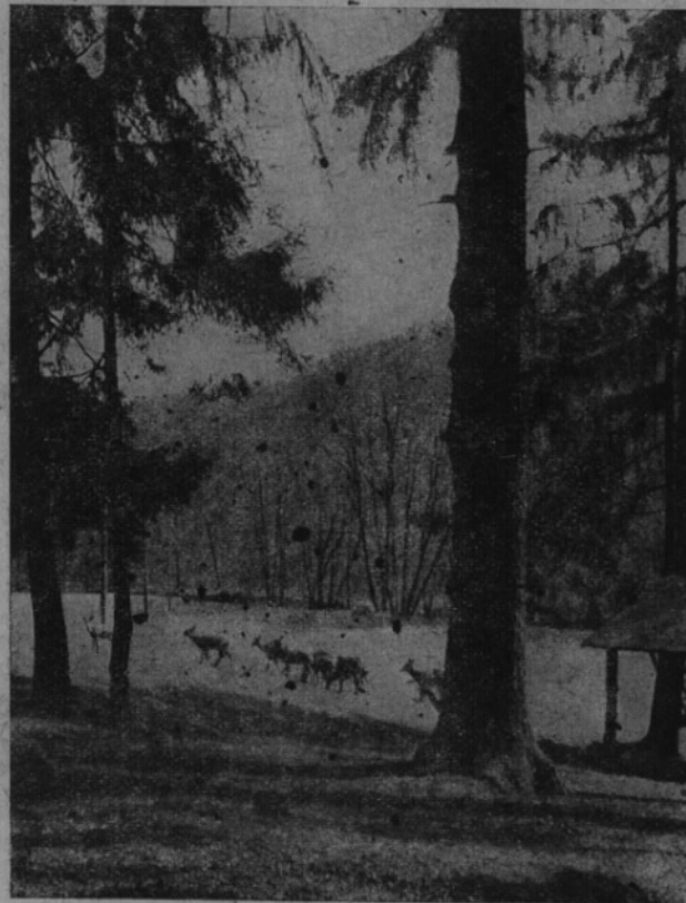
Zimní nálada — ale jen na obrázku

Letošní volby dávají nám k tomu dobrou příležitost. Je v našem i ve veřejném zájmu, aby nezůstala ne-