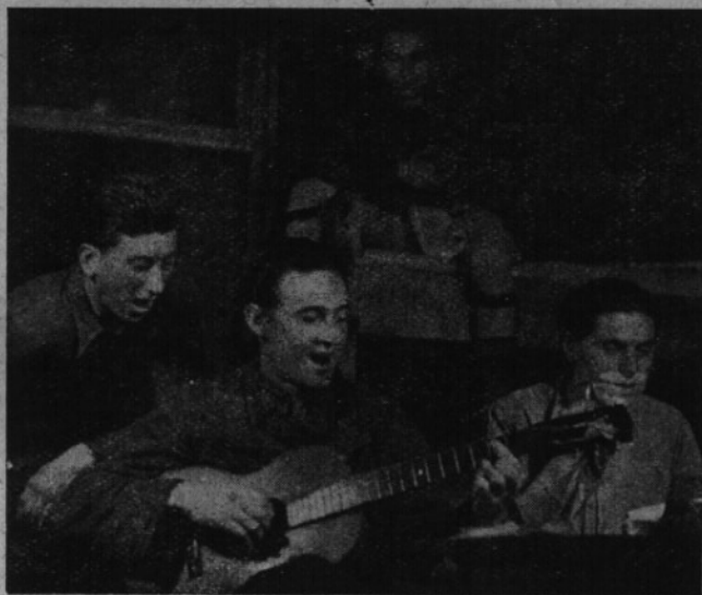
Život vojenský v míru je život veselý