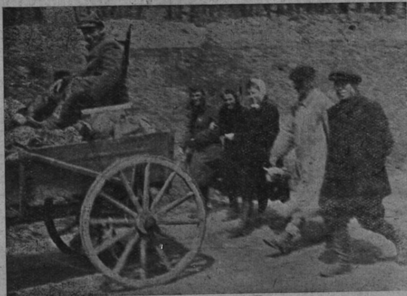
„Rodinný“ nástup do čs. voj. jednotky gen. Svobody na Volyni v březnu 1944 s celým příslušenstvím nebyl žádnou výjimkou