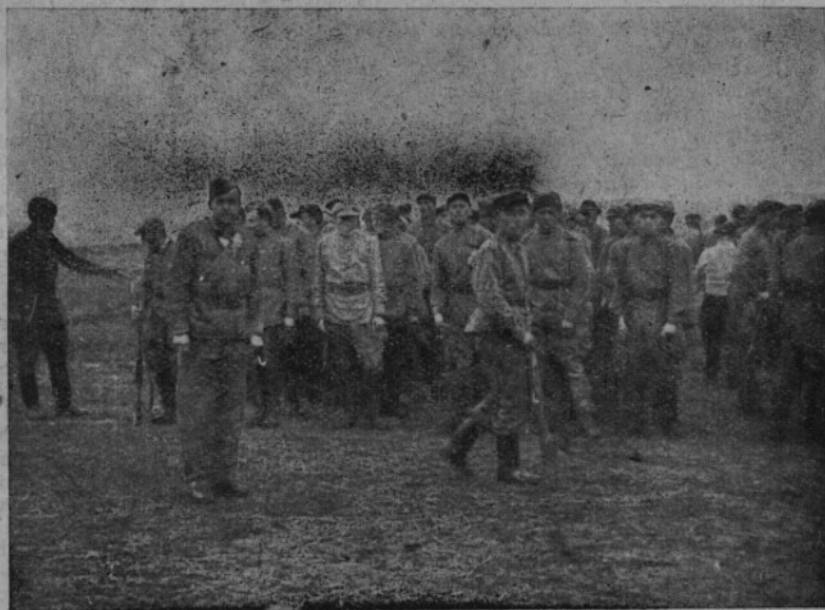
Intenzivní vojenský výcvik byl zárukou, že bojové úkoly čs. voj. jednotky v SSSR budou plněny úspěšně