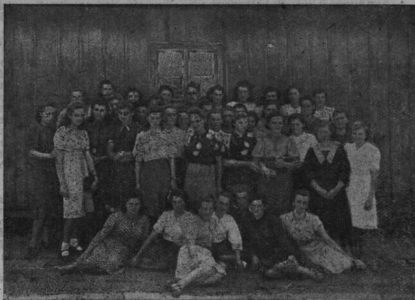
Skupina volyňských dívek, které se dobrovolně přihlásily do řad Svobodovy armády