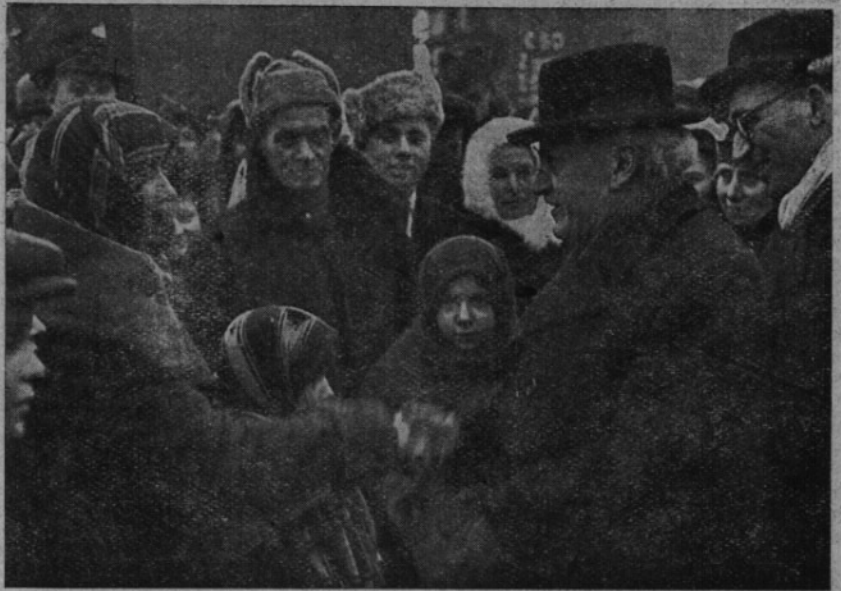
Loňské velikonoce jsme slavili ve znamení radosti z návratu do vlasti — letošní oslavíme ve znamení zvýšení pracovních výkonů pro její lepší příští.

Nedělní směna vítězství byla pro nás jakýmsi slavnostním úvodem k řadě dnů, které budou od úsvitu do