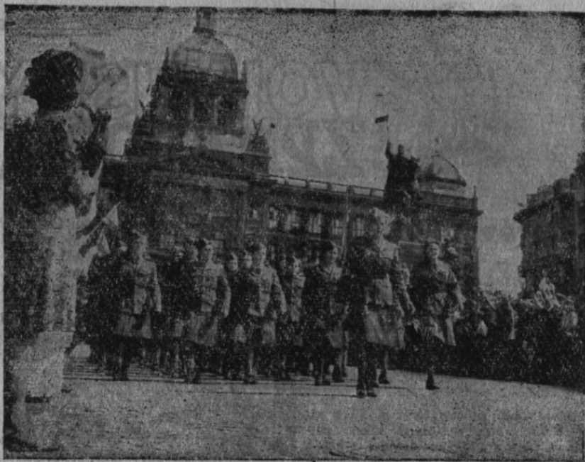
17. května 1945 pochodovaly Prahou vítězné oddíly čs. zahr. arm. ze SSSR. Na obrázku naše statečné dívky - Volyňáčky - vzbuzují všeobecnou pozornost a zájem Pražanů.