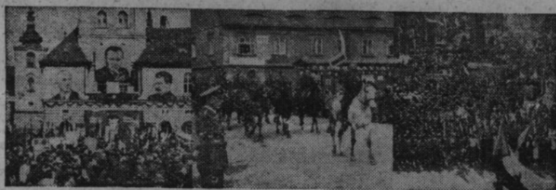
Tak jsme manifestovali v Žatci pro jednotu národa 1. května 1948. Stejně manifestačně uvítáme u nás prvního kandidáta kladenského kraje ministra vnitra Václava NOSKA v neděli 23. května t. r.

Při památce všech hrdinů — padlých Volyňáků — žádám vás, nečiňte tak, poskvrníte dobré jméno volyňských Čechů, před celým československým národem. Naše politická desorganisaace byla do únorových událostí omluvitelná. Avšak bílý lístek, vložený do urny volyňským Čechem by byl činem, který se rovná vlastizradě. V některých obcích našeho pohraničí jsou usídleni vesměs volyňští Čechové. V těchto (Dokončení na str. 2.)