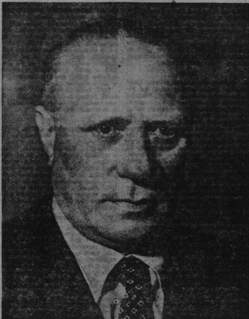
V neděli 23. května t. r. uvítal Žatec prvního kandidáta kladenského kraje ministra vnitra Václava NOSKA na předvolebním projevu.

Jeho mravní síla je neobyčejná. Imperialisté ve všech kapitalistických zemích cítí, že mohutné a silné Rusko je nepřekonatelnou překážkou pro jejich