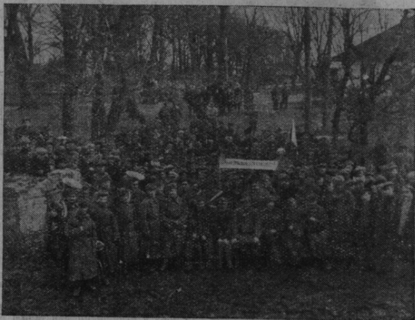
Občané Novokrajeva a blízkého okolí vstupují v březnu 1944 do československé zahraniční armády v SSSR.