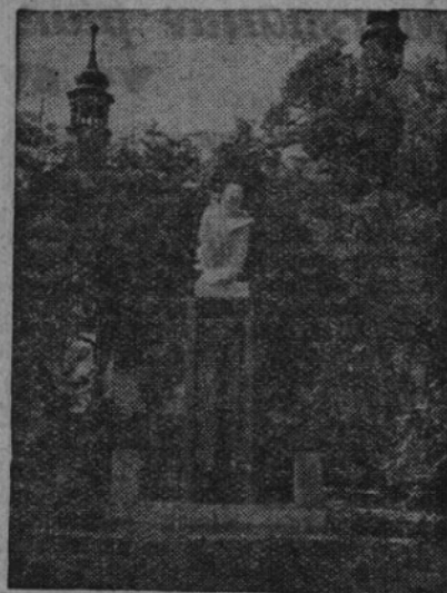
Pomník padlým býv. kvasilovským občanům v Liběšicích u Žatce

Slavnosti se také zúčastnila školní mládež a jeden ze žáků přednesl krásnou básně. Srdečný dík všem spolkům a korporacím za účast i nádherné věn-