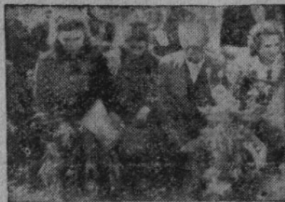
Český Malín naposled

A tak Český Malín, oběť fašistického pekla, se stal v očích volyňských Čechů visítkou německé zvrhlosti a přesvědčil i ty nejzarytější pochybovače o tom, že každý Němec je dobrý jen tehdy, když je pod drnem. Celá česká Volyně se hněvem zachvěla a skryté vypověděla německým katanům boj na život a na smrt.