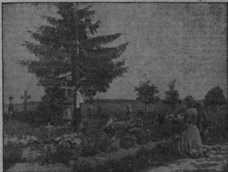
Jen hroby a kříže na místech, kde stával Český Malín, žalují a varují

Těm všem je třeba dnes a denně připomínat a stavět před oči obrazy Českého Malína, Lidic, Ležáků a dalších tisíců měst a obcí, zničených v (Dokončení na str. 2.)