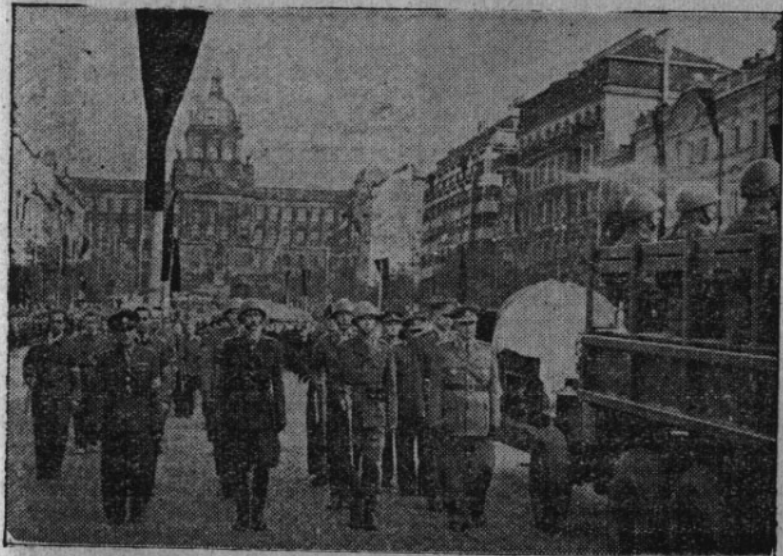
Smuteční průvod na Václavském náměstí v Praze. O rakvi čestnou stráž tvoří generálové v čele s ministrem nár. obrany arm. generálem L. Svobodou

A ještě malá vzpomínka. Roku 1939, polo odjížděje a polo prchaje z Prahy do Švýcarska, ohlásil jsem se ihned po příjezdu a dal k dispozici dr. E. Benešovi. Jak bylo jeho zvykem každému odpovědět — odpověděl, poděkoval a z jeho dopisu bylo jasné, jak ho těší, že s k němu hlásí lid. Tam ve Švýcarsku jsem se teprve dozvěděl, jak si nesmírně našeho prezidenta váží cizina. V době války se nové zprávy jen hrnuly, stačil