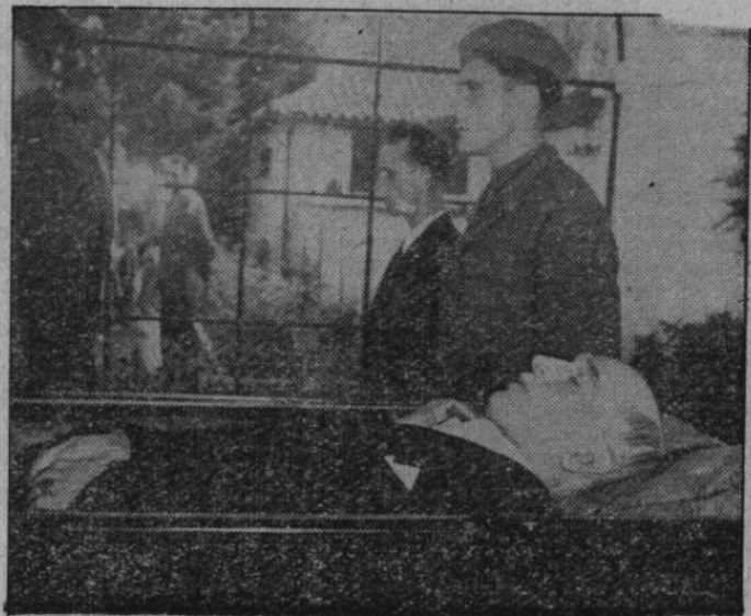
President - Budovatel dr. E. Beneš v rakvi.

Tolik lidí přišlo! Jsou tu zase typické štafle a jiné rekvizity. Pražané obsadili okna, kdejakou terasu, stojí na střeších, sedí na komínech a na stromech. Jízdní dráha je v celé délce posypána červenými a bílými kafiáty. K rakvi nastupuje poslední čestná stráž generálů v čele s min. L. Svobodou. Před rakví je velký věnec prezidenta Gottwalda a ještě jeden velký věnec, kde na stuze je napsáno jen jediné slovo: „Hana“. Přichází prezident Gottwald, sklání se