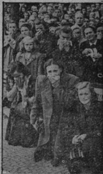
Z cestě s prezidentem dr. E. Benešem.

Skláníme se před životem a dílem jednoho z nás. Před životem a dílem dr. Edvarda Beneše, druhého prezidenta Československé republiky. V úctě, ve vděčnosti a v opravdovém smutku. A v neotřesitelné a nezlomné víře a přesvědčení, že cesta, po které jdeme, po které jde tento stát a tento lid, je cestou spravedlivou, dobrou a pokrokovou. Protože navazuje na nejlepší, co v tomto státě vyrostlo, aby nás bezpečně dovedla k plné svobodě: k plné demokracii a k