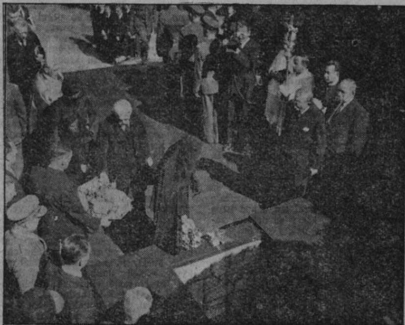
Poslední sbohem v Sezimově Ústí. Paní Hana Benešová vhadzuje do hrobu květiny

Svaz Čechů z Volyně zaslal u příležitosti úmrtí druhého presidenta republiky dr. Edvarda Beneše choti zesnulého paní Haně Benešové tento telegram: