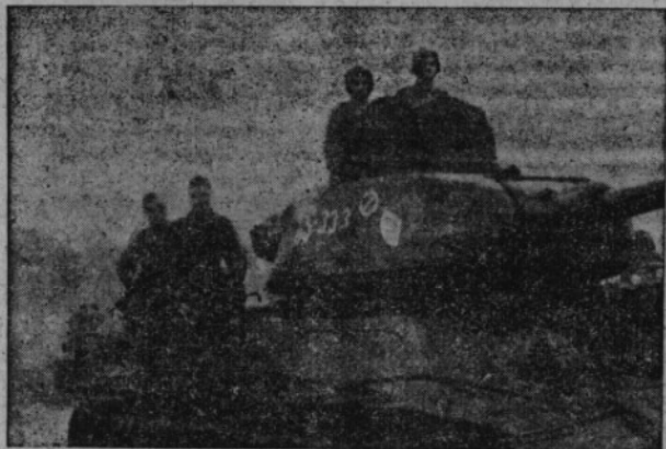
Slavní tankisté I. čs. sam. tank. brig. v SSSR a tankoví automatčelci zasáhli vždy na nejhroženějších úsecích fronty