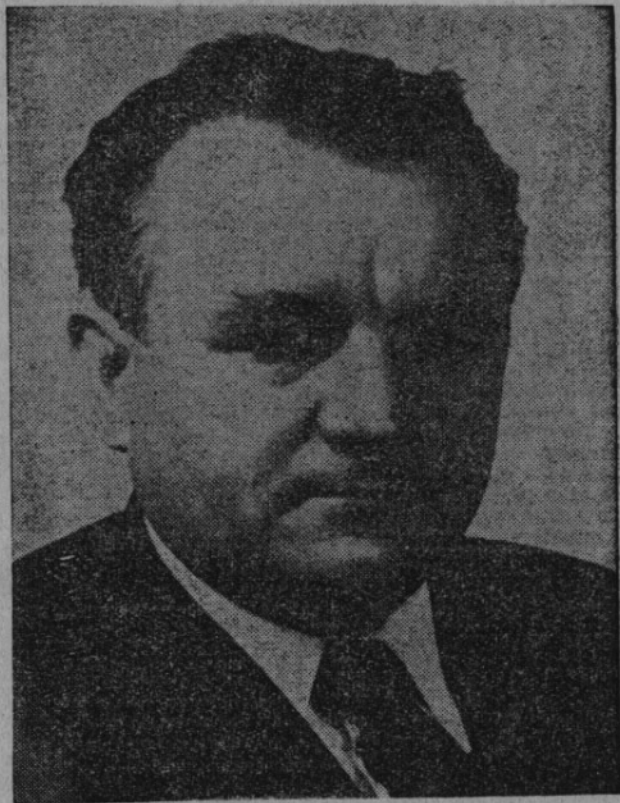
President republiky Klement Gottwald

Poměr pociivého Čecha a Slovaka k Sovětskému svazu může být jen jeden, a to poměr přátelství, vděčnosti, věrnosti. Podlamovat náš svazek s SSSR a zasévat nedůvěru v něj i v jeho mírumilovnou, protimperialistickou politiku