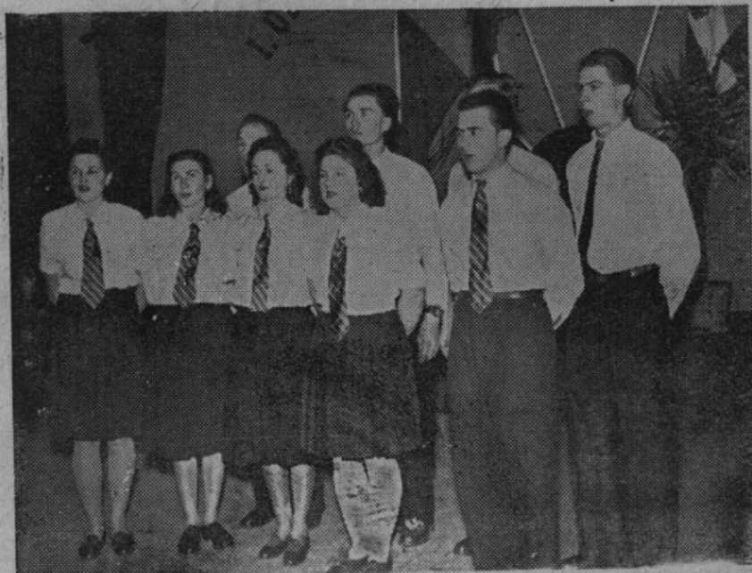
Kult. četa „Volyň“ ze Suchdolu n. O. si odvezla dvě přední ceny. Umístila se na prvním místě ve sbor. recitaci a na druhém místě ve sbor. zpěvu