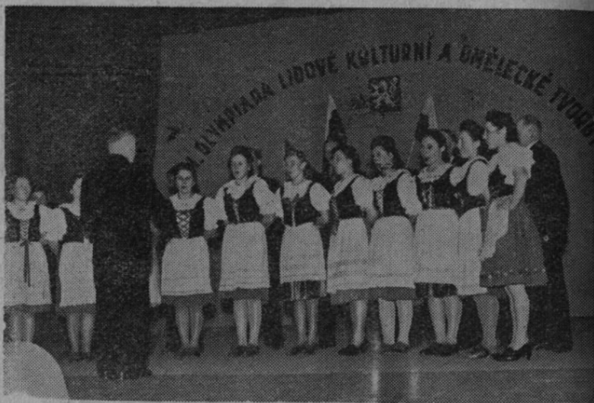
Pěvecký sbor „Boratín“ z Chotiněvse u Litoměřic, známý svým uměním ještě z Volyně, obsadil prvé místo ve sborovém zpěvu