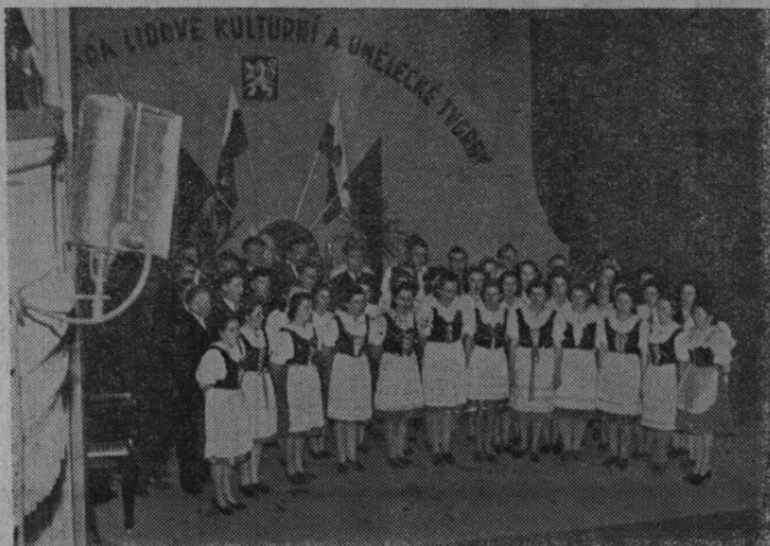
Účastníci 1. olympiady lidového umění a tvorby vol. Čechů zahájili veřejné vystoupení vítězů v Městském divadle v Žatci 28. XI. 1948 státními hymnami československou a sovětskou