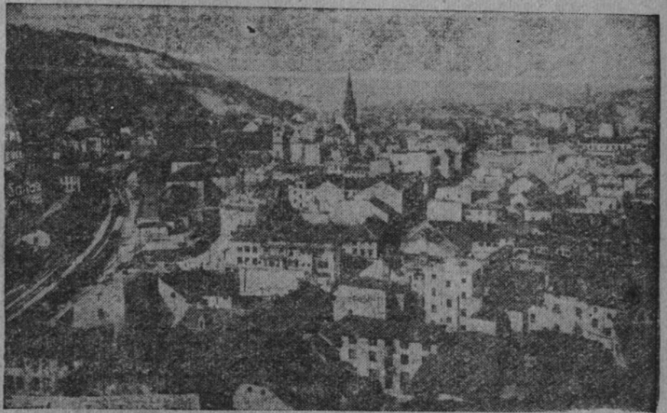
Do Ustí n. L. přijdou ve dnech 2. a 3. dubna 1949 reemigranti z celého kraje na svůj budovatelský sjezd.

Kdo tedy může chtít válku? Odpověď je velmi snadná a jednoduchá. Válku chce a připravuje hrstka lidí, která na ni vydělávala a doufá, že vydělá zase těžké miliony.