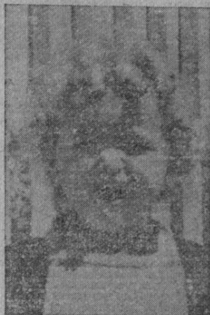
Dětská radost - trvalý program!

Děkuji měnům města všem, kdo se o úspěch Týdne dětské radosti přičinili a