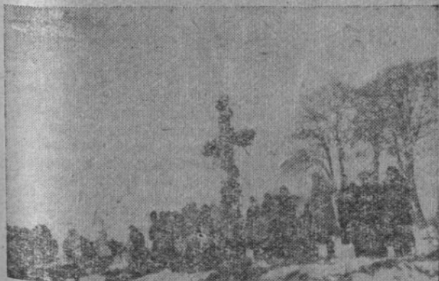
Společný hrob v Českém Malíně s připravenou prstí pro urny před panychidou 20. I. 1947