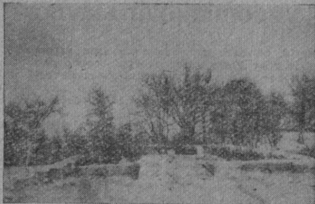
Zbytky kostela v Ukr. Malíně, v němž byli upaleni muži — Ukrajinci i Češi

Na konec slavnosti věnoval protorej Kotčuk jménem přifařených občanů ukrajinské národnosti přesídlo-