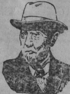
И. В. Мичурин

Одним из самых смелых его умыслов является акклиматизация фруктовых деревьев и ягодников. Под словом акклиматизация надо понимать „приучение“ растения жить в новых условиях произрастания, например взять типичное южное растение, переместить его в северные районы страны и здесь целым рядом мероприятий заставить его приспособиться к новым почвенно-климатическим условиям. Много видов растений Мичурин таким образом заставил жить в новых, им непривычных условиях. Так он приучил к новым условиям произрастания це-