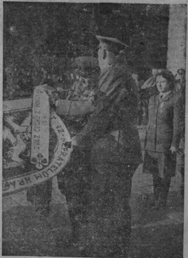
Zástupci Svazu Čechů z Volyně připínají stuhu na praporec voj. útvaru „Volyňských Čechů“ v Zatci 28. listopadu 1948