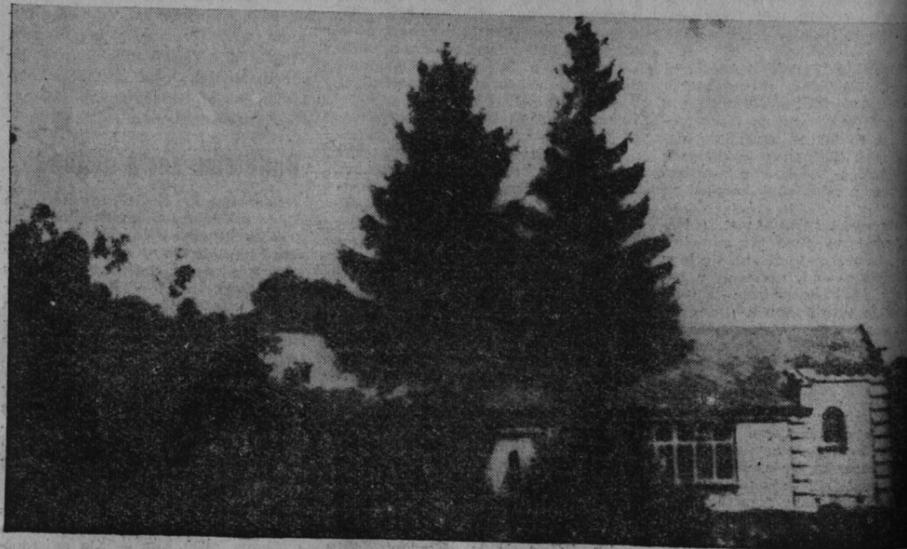
Školní budova v Moskovštíně