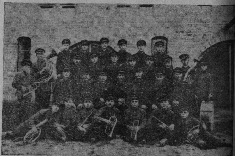
Sbor dobrovolných hasičů v Moskovštině