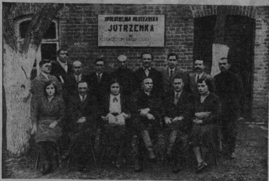
ředstavenstvo mlékařského družstva v Moskovštině

Poláci začali se na ně utrhovati, i když před tím s nimi dobře vycházeli. Bezdůvodně je napadali, ale ani toho si vesnice Moskovština valně nevšímala. Lidé v ní znali jen práci a zase práci.