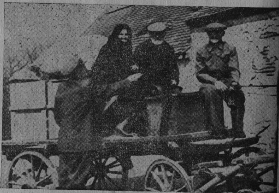
Dědeček a babička Valentovi, kteří jako malé děti odjeli na Volyň, se vrátili zpět do své milované vlasti.