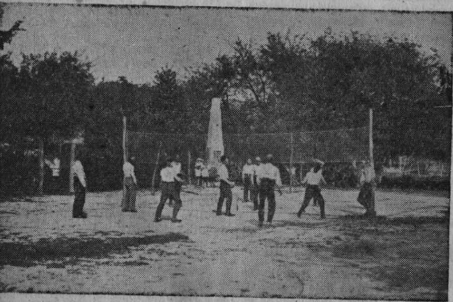
Hospodář v Moskovštině při družné zábavě po pilné práci.