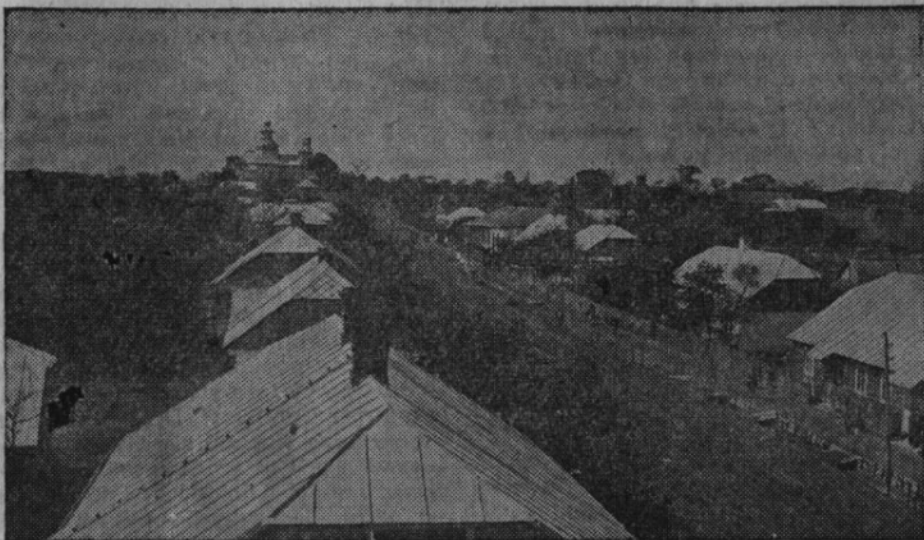
K u p i č o v — jedna z nejvyspělejších obcí na Volyni, jež svou typickou výstavností prozrazuje na prvý pohled český původ. Začátek popisu této obce přinášíme na str. 6.

Samotný sběr historického materiálu pro naše dějiny měl by se státí věcí cti každého z nás, volyňských Čechů. Zde by skutečně bylo na místě i soutěžení, abychom veškerý materiál, ať už jsou to popisy, nebo materiál jiný, sebrali co nejdříve, aby konečně také bylo možno přikročit k zpracování sebraného materiálu a sepsání našich dějin. Musíme pamatovat, že i když tuto práci bude dělat celá redakční komise, bude to práce na několik let a každý ztracený rok znamená nenahraditelnou škodu. Už z důvodů propagačních. Nemusím ani zdůrazňovat, že celá československá veřejnost ví o naší minulosti a o našem přínosu v zápase o československou samostatnost velmi málo, ba, možno říci, čím dále, tím méně. Vlna zde je velká na naší straně, poněvadž především my jsme neuměli tento svůj přínos dostatečně popularisovat. Zabrali jsme se všichni tak do svých osobních záležitostí, že jsme na to úplně zapomněli. Až na čestnou výjimku několika málo svazků od našich volyňských autorů nebylo dosud vydáno nic skutečně historicky cenného. Také činnost našich volyňských básníků a literátů-beletristů úplně ustala, ač by mohly být dnešního dne vydány celé knihovny. To všechno leží dosud před námi jako skutečně „liška nezoraná“. Není se proto mož-