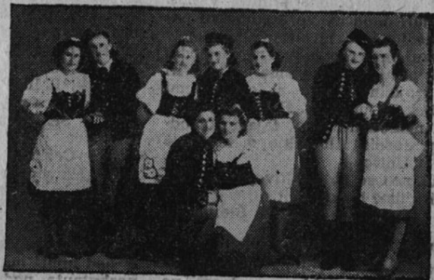
Mládež z Moskovštiny v českých krojích při slavnostních příležitostech.