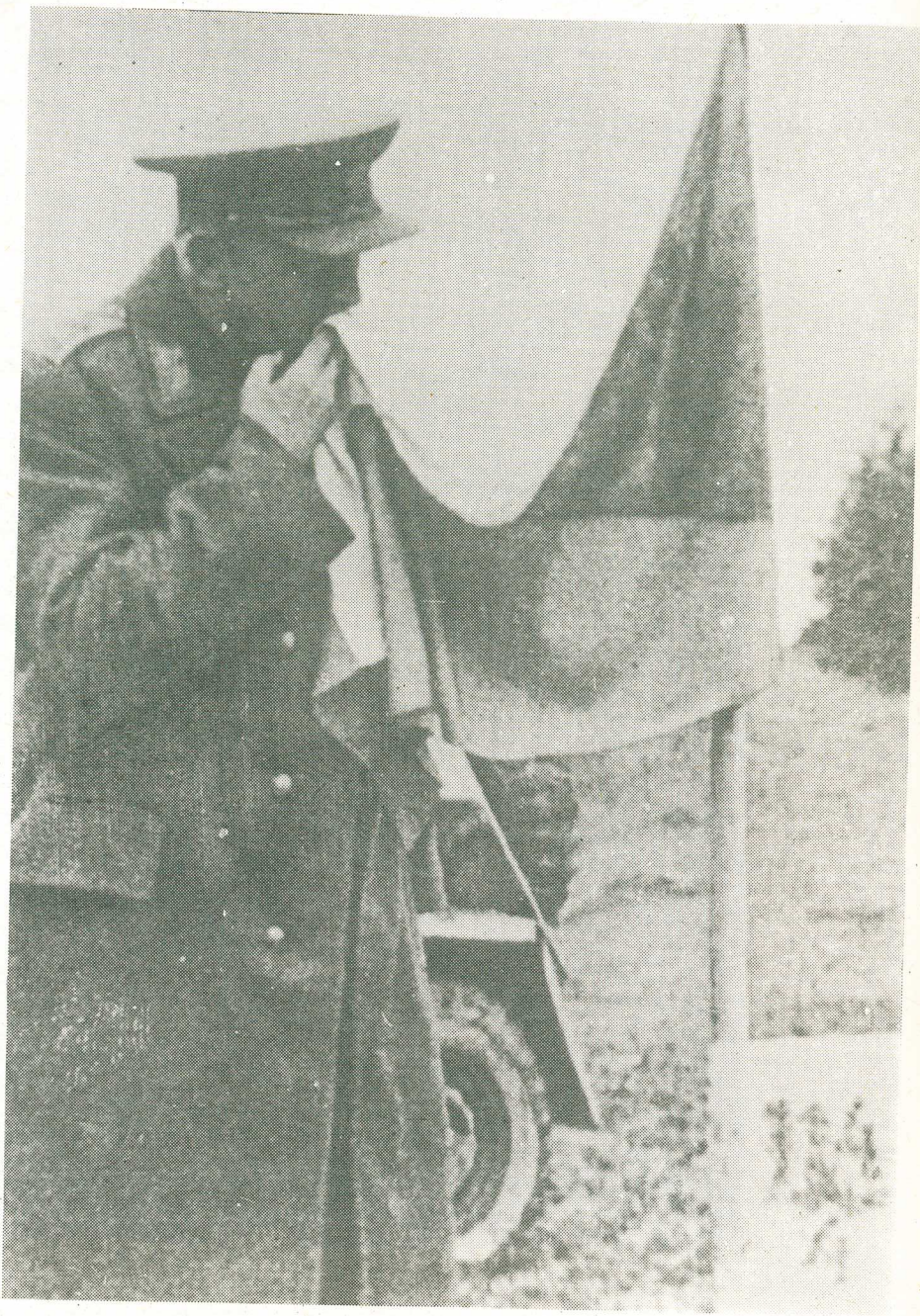
Generál Ludvík Svoboda vzdáva úctu čs. štátnej vlajke na čs. – poľskej hranici