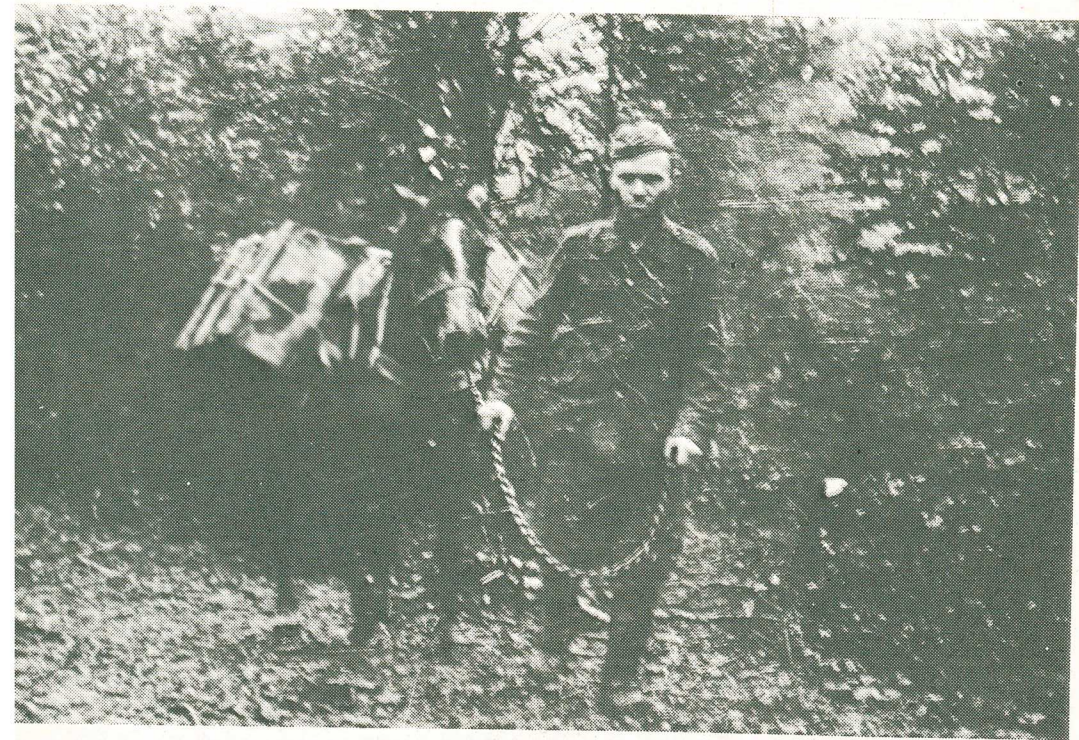
Doprava munície do predných líní Čs. delostrelectvo