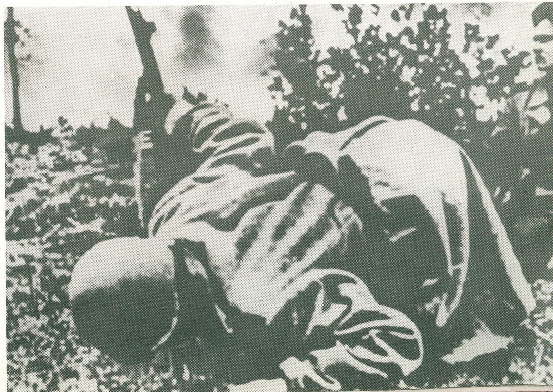
Čs. vojak bozkáva rodnú zem po prechode čs. – poľskej hranici