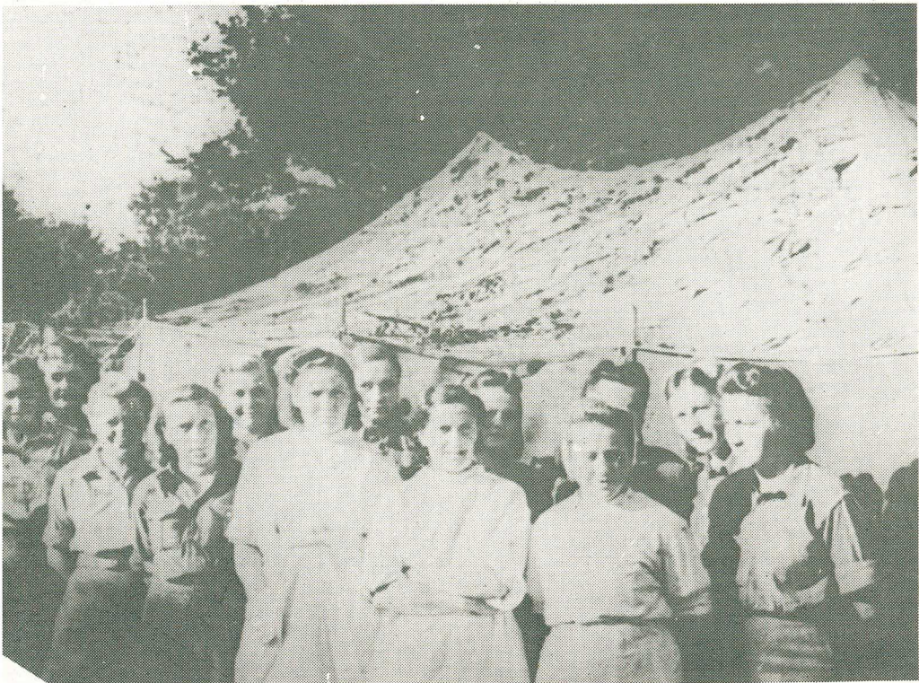
Zdravotníčky 1. čs. armádného zboru