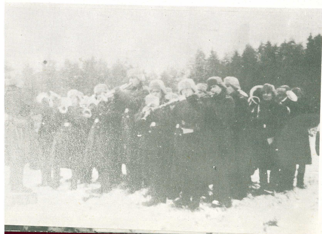
Pohreb Víta Nejedlého 4. januára 1945