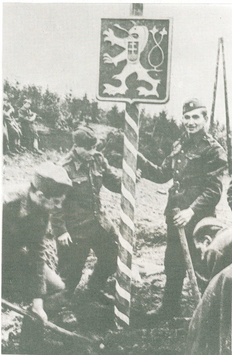
Zakopávanie čs. hraničného stĺpa