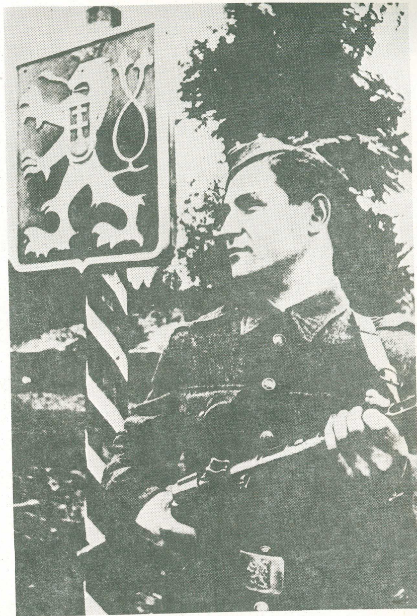
Desiatnik Porochnavec ako čestná stráž pri čs. hraničnom stĺpe