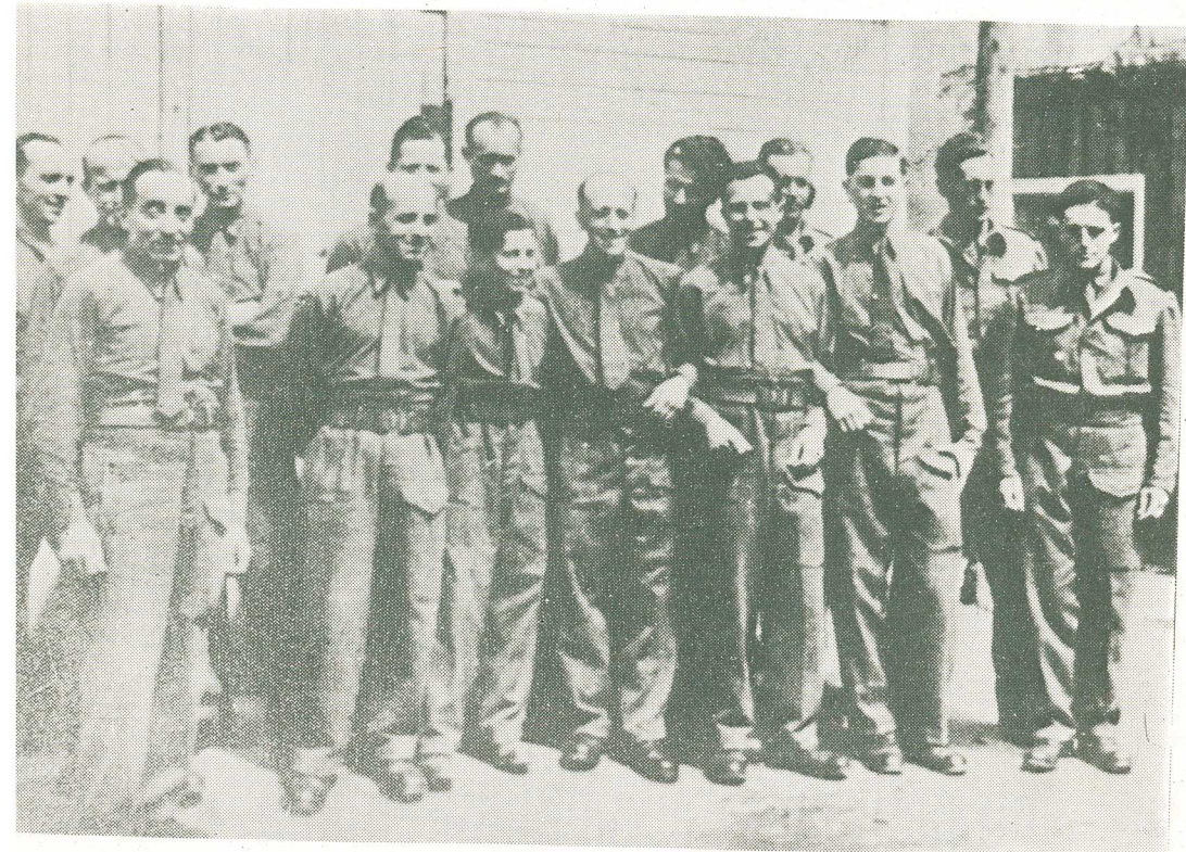
Časť súboru 1. čs. armádneho zboru 5. decembra 1942 v Buzuluku