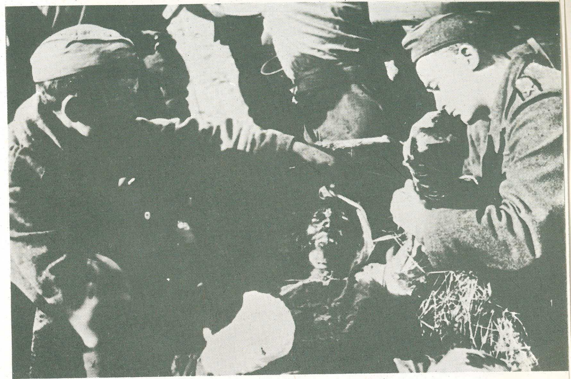
Ošetrovanie ranených vojakov