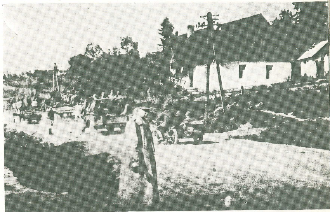
Generál L. Svoboda sleduje presun čs. vojsk