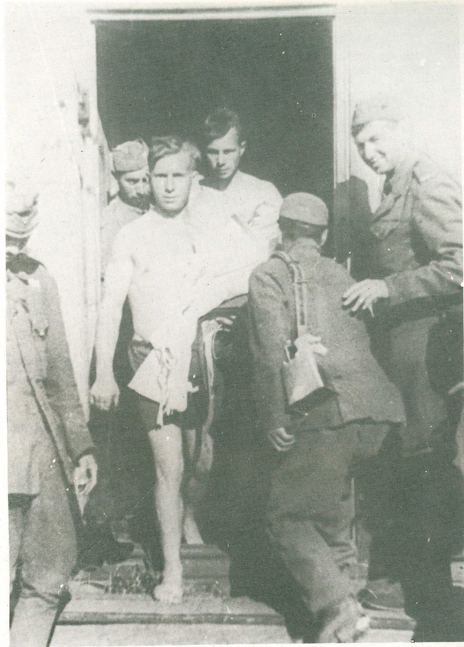
Hygienická očista vojakov 1. čs. armádneho zboru