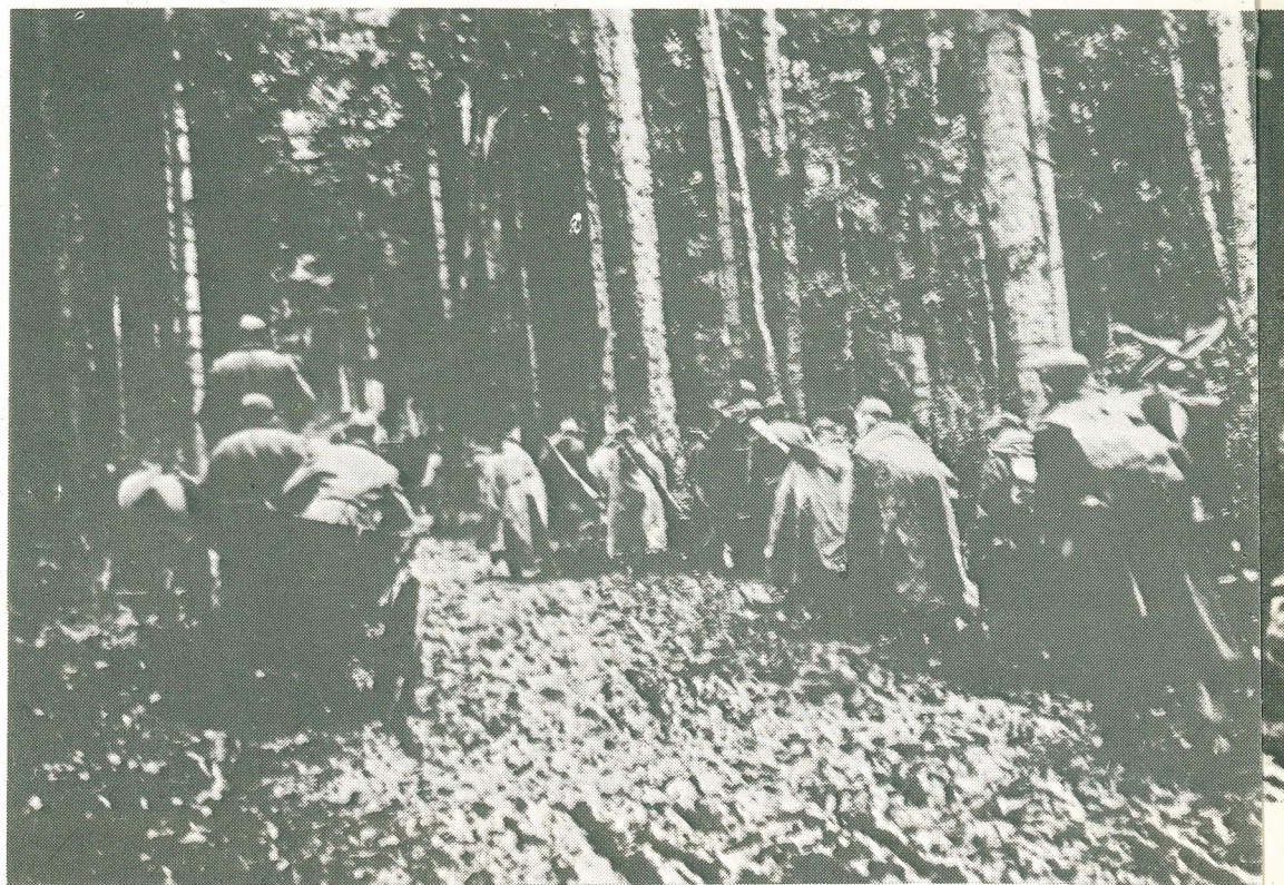
Postup čs. pechoty