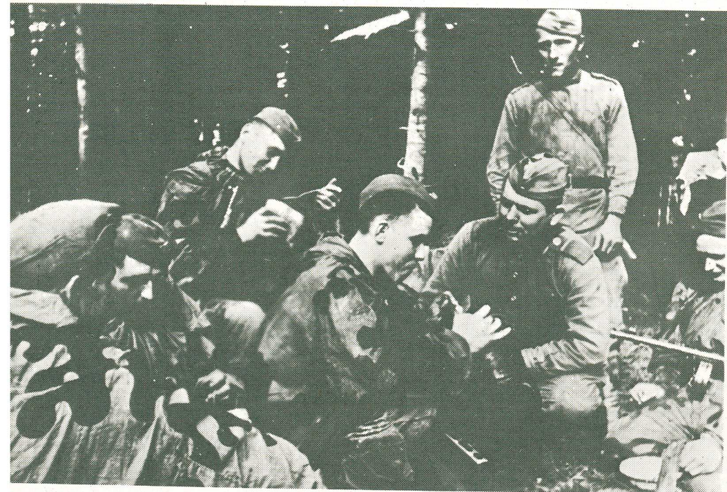
Príslušníci 1. čs. armádneho zboru vo chvíľach odpočinku