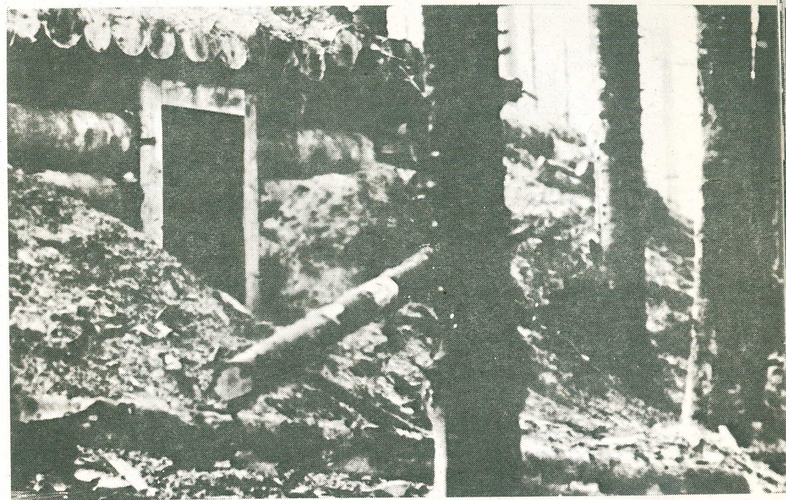
Drevozemný kryt Čs. delostrelci v Dukelskom priesmyku