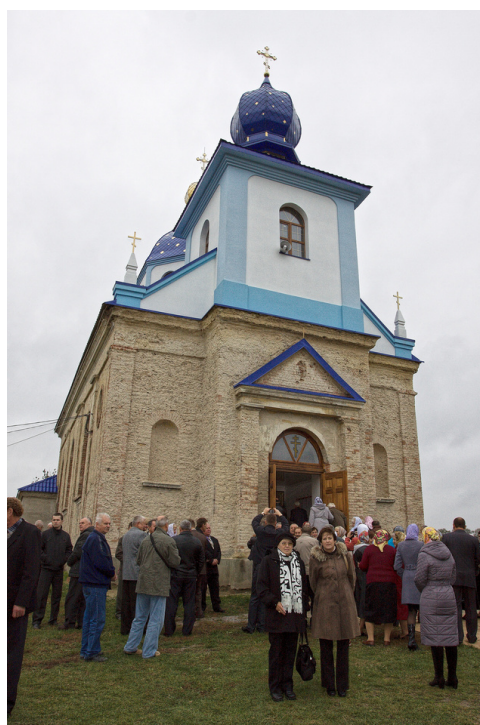
Kostel v Hrušvicích při znovuotevření a zájezd volyňských Čechů z ČR.