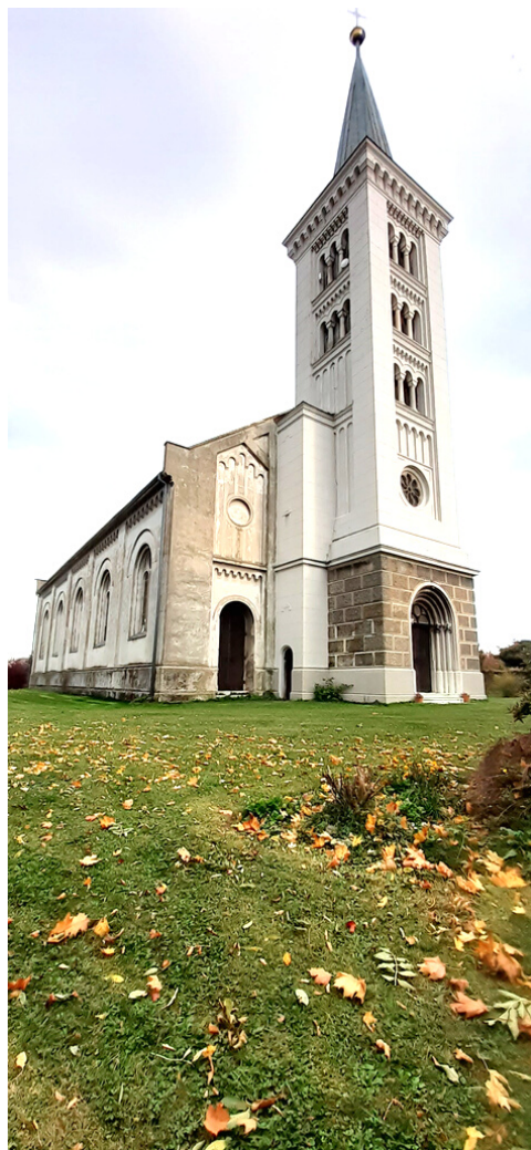
Kostel ve Slezských Rudolticích.

Text: Ludmila Čajanová, foto: Mikuláš Galuzska