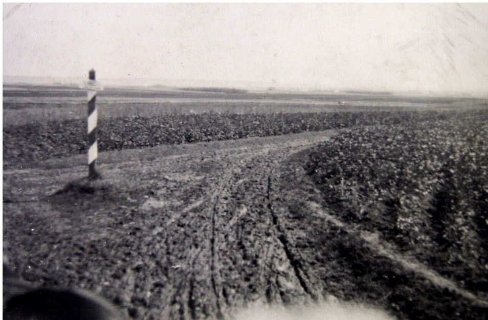
Hraniční sloup mezi Ostrohem a Slavutou.

K potomkům volyňské větve knížecího rodu pravoslavných Rurikovců patřil K. I. Ostrožský, který usiloval o spojenectví Litvy s katolickým Polskem, aby tak bylo