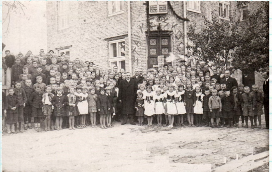
Českou školu v Lucku a její žáky navštívil československý vyslanec v Polsku Juraj Slávik (uprostřed fotky), zřejmě kolem let 1936–1938.

V Národním muzeu je uložena řada fotografií, předmětů a dokumentů, které se týkají vzdělávání na Volyni. Zde přinášíme malou ukázkou.