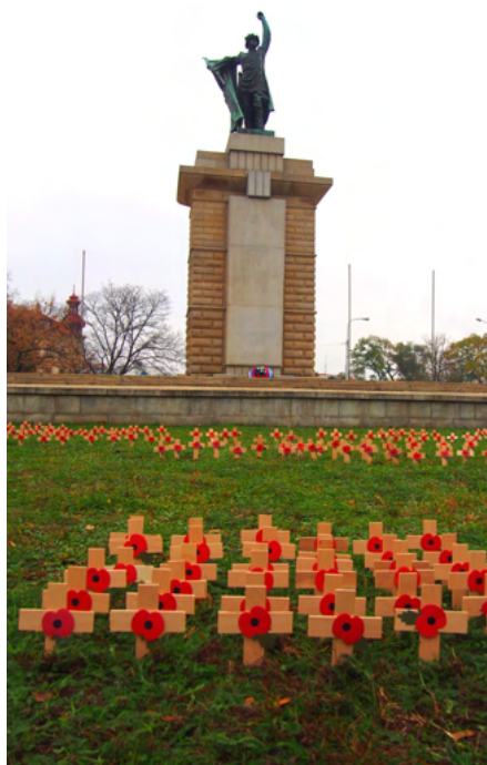
Nahoře: symbol DVV vlíčí mák. Dole: Každý návštěvník může instalovat křížek se jménem svého předka.