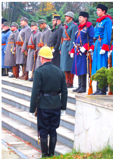
Foto vlevo: Ukázka vojenské techniky. Foto vpravo: Slavnostní nástup vojsk.