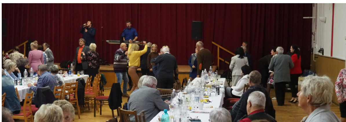
Vystoupení Karel Gott revival Morava a tanečníci.