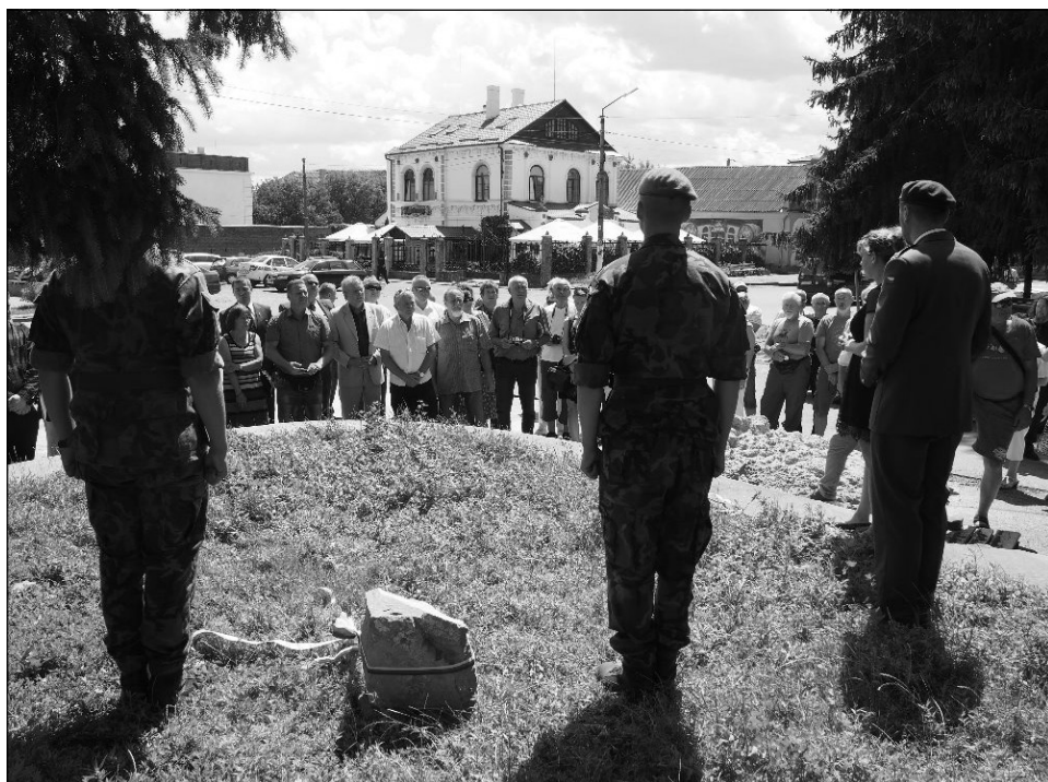
Základní kámen, Dubno

Před mým odjezdem z Bohdalic na místo nástupu do autobusu ve Vyškově, při kvapném dobalování věcí na cestu, mi asi kolem desáté dopoledne zavo-