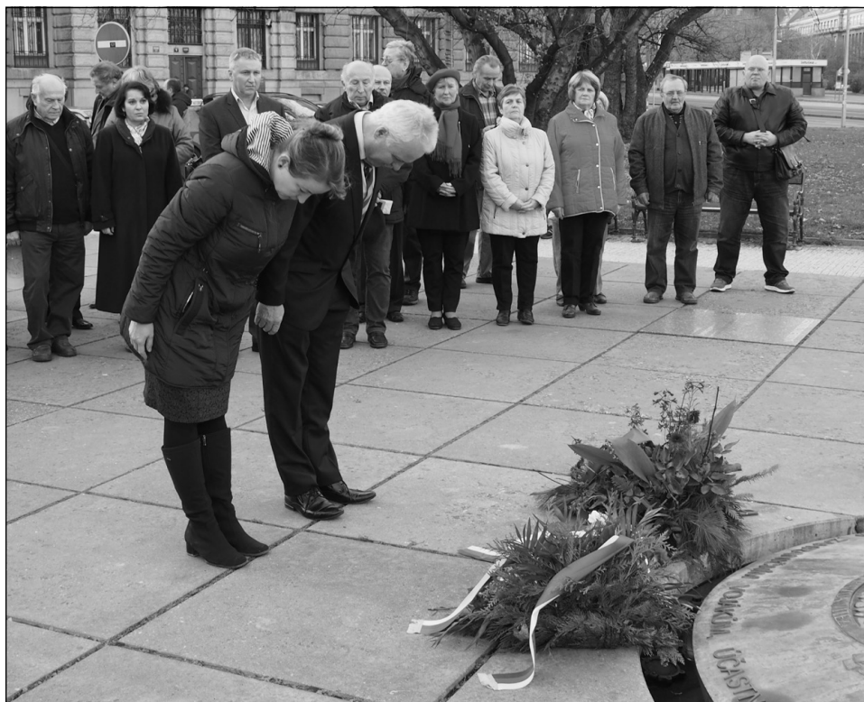
Ceremoniál u pomníku

22. 11. 2017 se v Praze v Domě armády uskutečnila celostátní konference na výše uvedené téma.