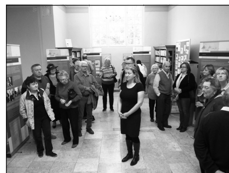
Návraty volyňských Čechů – vernisáž

Na počátku října do Městské knihovny v Chebu doputovala naše putovní výstava „Návraty volyňských Čechů“, která svým obsahem mapuje od roku 1868 stopadesátiletou historii této poměrně početné etnické skupiny od jejího příchodu na Volyň, podílu na vzniku České družiny, Čs. legií a 1. čs. armádního sboru až po tři vlny jejich návratu do Čech.