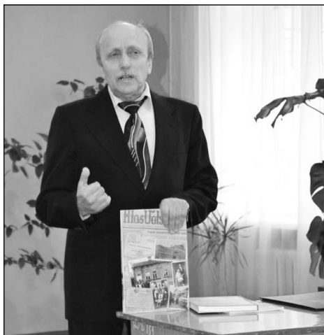
Zdolbunov – prezentace

Poté byla zahájena putovní expozice o životě prvního prezidenta Československa Tomáše Garrigue Masaryka a byl o něm promítnut dokumentární film.