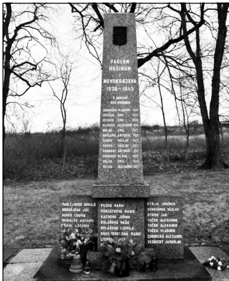
Památník obětem 2. SV, Podbořany