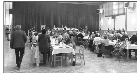
Setkání Moravskoslezského regionu

V sobotu 14. září 2019 se uskutečnilo tradiční setkání volyňských Čechů a jejich přátel v Suchdole nad Odrou.